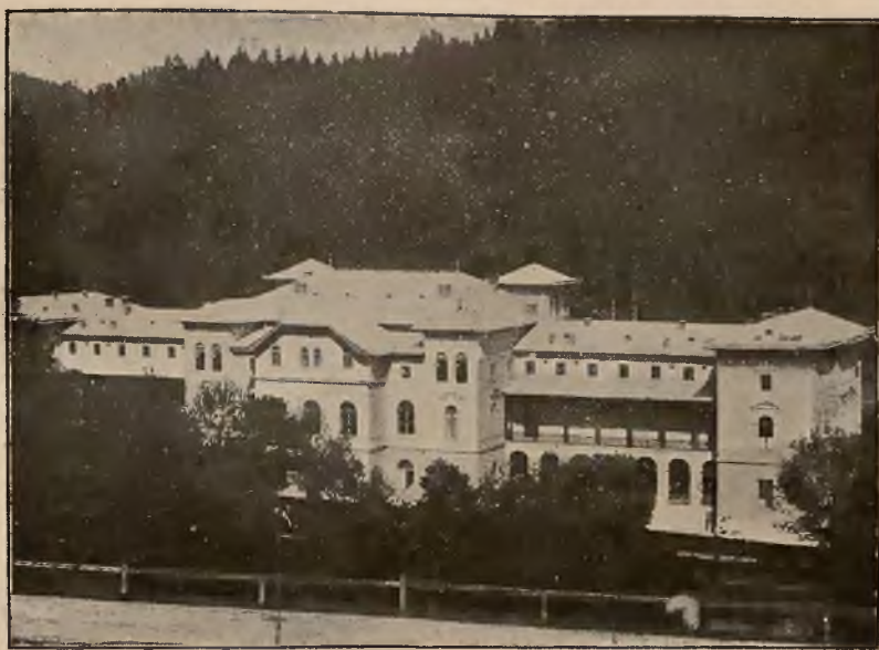
DOM ZDROJOWY OD ZACHODU.

Osobne bezpośrednie wa- gony z Krakowa i Pod- wołoczysk.