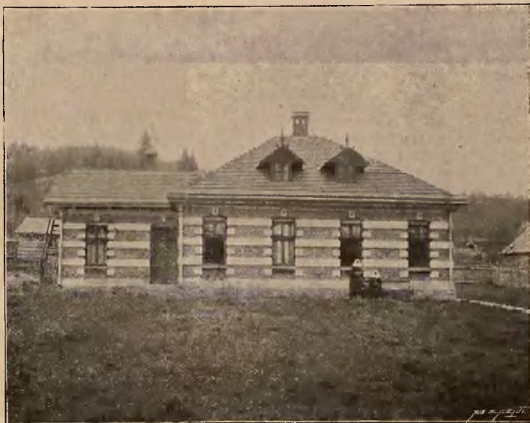
DOM IZOLACYJNY W KRYNICY.

Osobne bezpośrednie wa- gony z Krakowa i Pod- woleczysk.