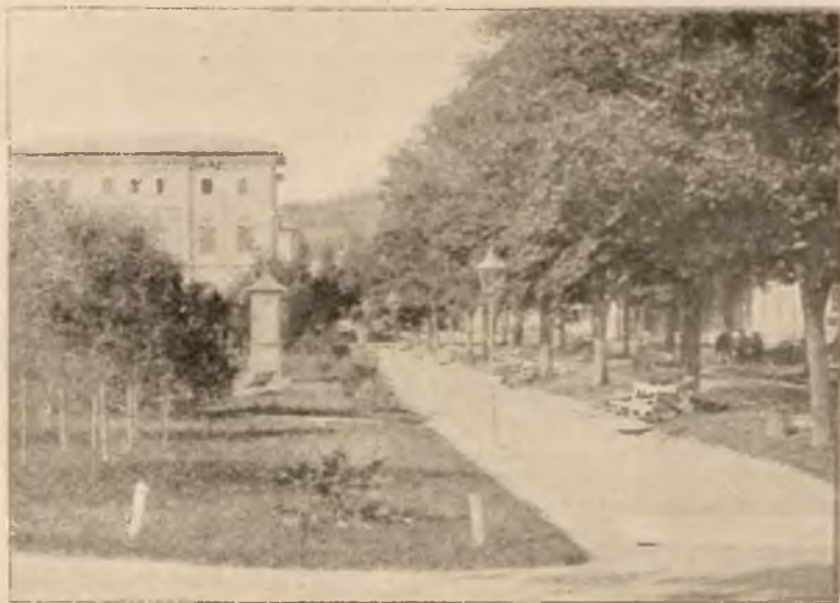
KIOSK METEOROLOGICZNY PRZY DEPTAKU.

Od 15-go czerwca osobne bezpośrednie wagony z Krakowa i Lwowa.