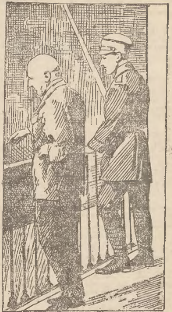
Gabryel d'Annunzio, głośny poeta włoski, w czasie ostatniego strajku generalnego we Włoszech, nawołując robotników do podjęcia pracy. Jak wiadomo d'Annunzio popiera ruch faszystów.

(PAT) Kursa końcowe. Berlin 0.29; Holandia 205; N. Jork 524.75; Londyn 23.47; Paryż 39.65; Medjolan 22.65; Madryt 81.60; Bruksela 37.50; Kopenhaga 113; Sztokholm 140.25; Chrystiania 89.50; Buenos Aires 189.25; Praga 18.70; Budapeszt 0.29; Zagrzeb 1.45; Warszawa 0.06 i pół; Wiedeń 0.00 i pół; Stem. austr. kor. 0.00 trzy czwarte; Sofija 3.