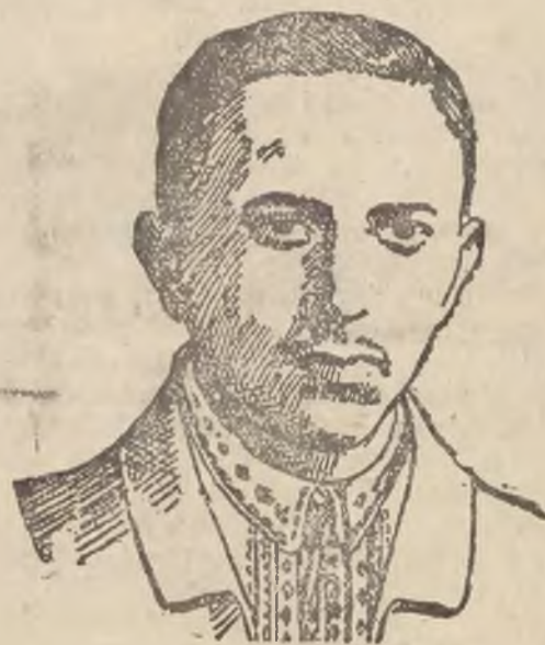
STEFAN JAROSŁAW 2 IM. FEDAK

Projekt ów został już odesłany do komisji finansowej, która wprowadziła w nim poprawki, mające na celu udzielenie Polsce pożyczki od razu w całej kwocie 400 milionów franków.