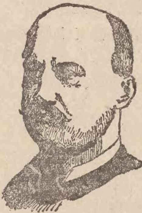
S. P. GABRJEŁ NARUTOWICZ.

Sprawca zamachu Niewiadomski został aresztowany.