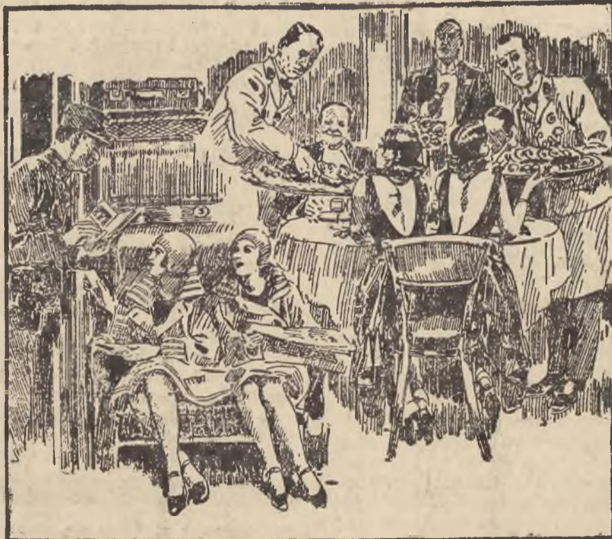
KŁOPOTY „SIÓSTR SYAMSKICH” (Do artykułu na stronie 8-mej).

do nabycia w pierwszorzędnym magazynach zegarmistrzowskich i jubilerskich. 6315