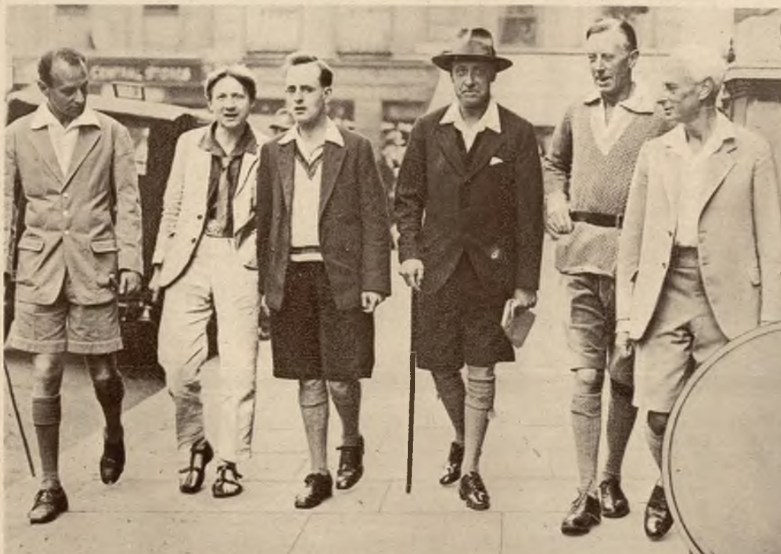
Zwolennicy zreformowania stroju męskiego, urządzili w Londynie pokaz nowych mód męskich. Moda ta stoi pod znakiem wygody i celowości stroju, twórcy jej jednak zbyt mało kładą nacisk na stronę estetyczną ubrania.