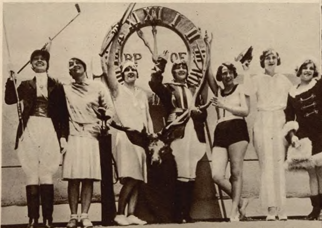
Jedna z grup wielkiego pokazu mód sportowych w Los Angeles (Kalifornia); uczestniczki jej personifikują 7 najpopularniejszych sportów: polo, golf, tenis, lotnictwo, pływanię, żeglarstwo, łyżwiarstwo.