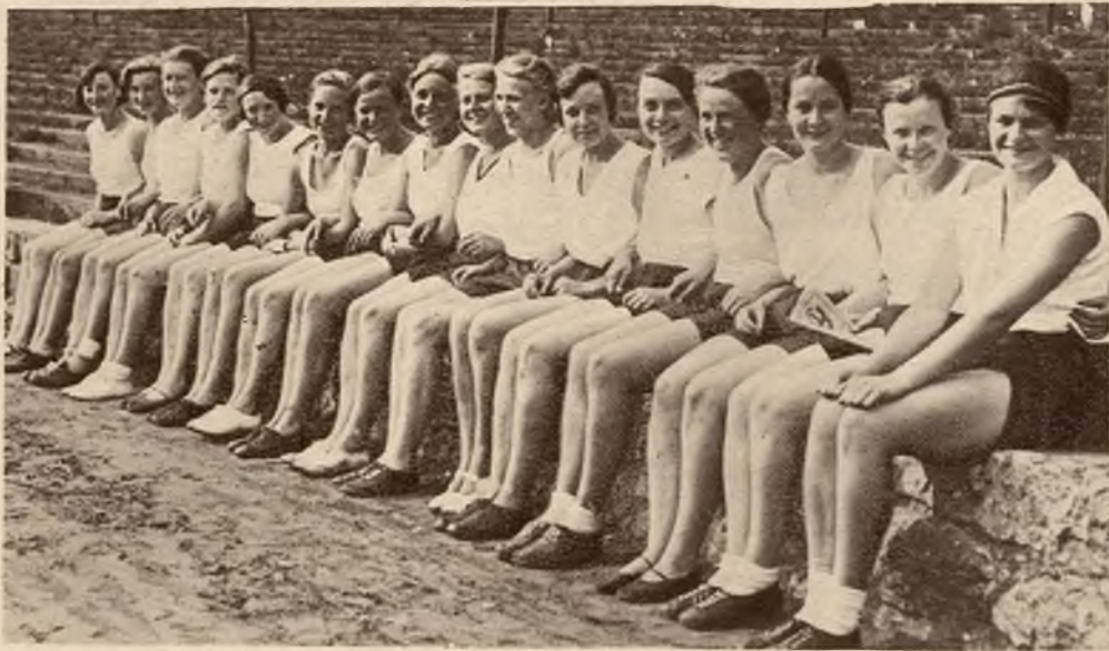
Studentki uniwersytetu berlińskiego wypoczywają po zawodach sportowych.