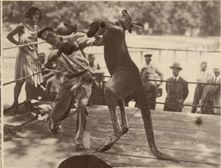
Kangur-bokserem Wytrenowany kangur, walczący według wszelkich zasad boksu, zwycięża wszystkich swoich ludzkich przeciwników.