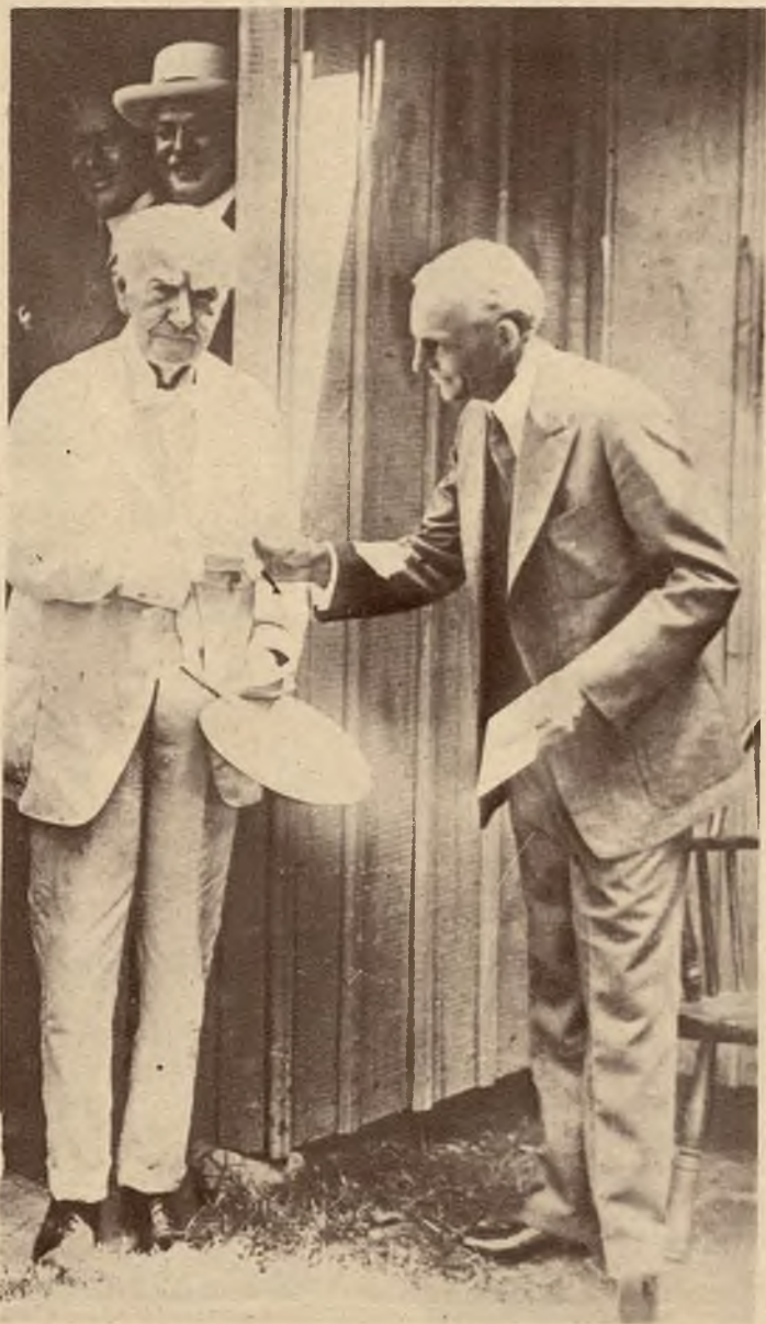
Drewniana szopa, w której zabłysła pierwsza żarówka elektryczna, zakupiona została dla fordowskiego muzeum osobliwości. Na zdjęciu widzimy Edisona wręczającego klucz od szopy Fordowi.

Na prawo: Afisz symbolizujący „Pokój światowy” został w Ameryce nagrodzony nagrodą 15.000 dolarów.