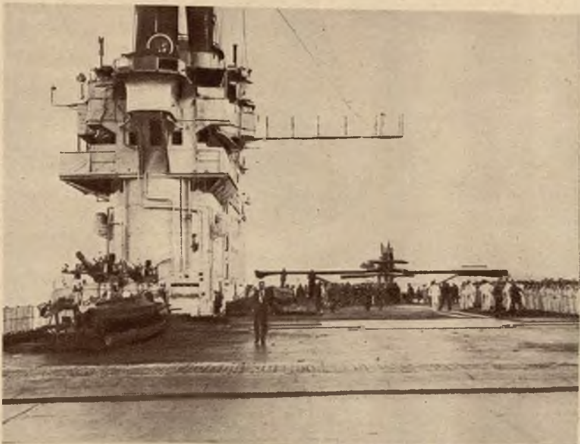
Widok pokładu i wieży armatniej angielskiego statku wojennego „Eagle”, który uratował lotników hiszpańskich. W głębi samolot „Numancja”.

Na prawo: Afisz symbolizujący „Pokój światowy” został w Ameryce nagrodzony nagrodą 15.000 dolarów.