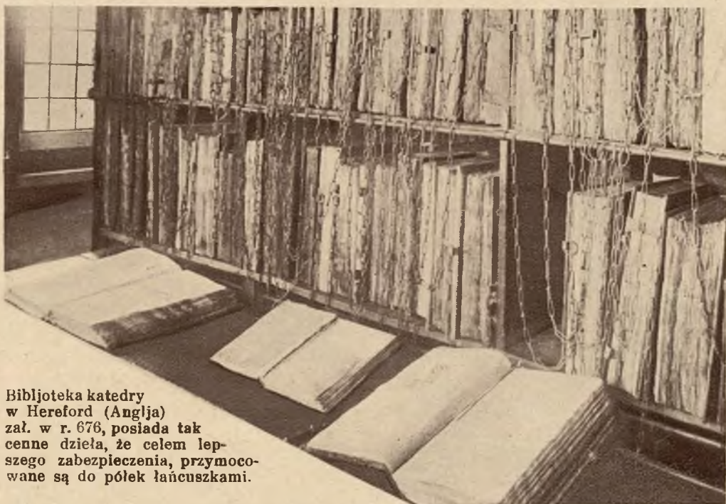
Biblioteka katedry w Hereford (Anglia) zał. w r. 676, posiada tak cenne dzieła, że celem lepszego zabezpieczenia, przymocowane są do półek łańcuszkami.