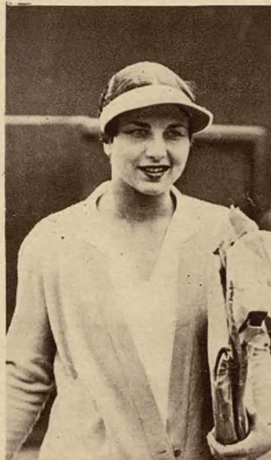
Amerykanka Helen Wills na turnieju tenisowym w Wimbledon (Anglja) zdobyła po raz trzeci mistrzostwo świata.