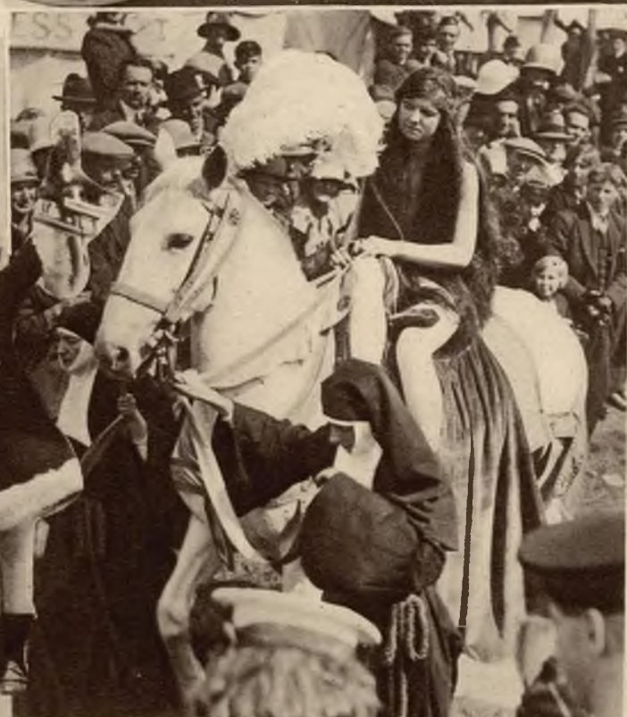
Podczas pochodu kostiumowego, urządzonego przez szpital w Coventry (Anglia) zwracała uwagę tłumów postać, przedstawiająca „Lady Godivę” na białym koniu.