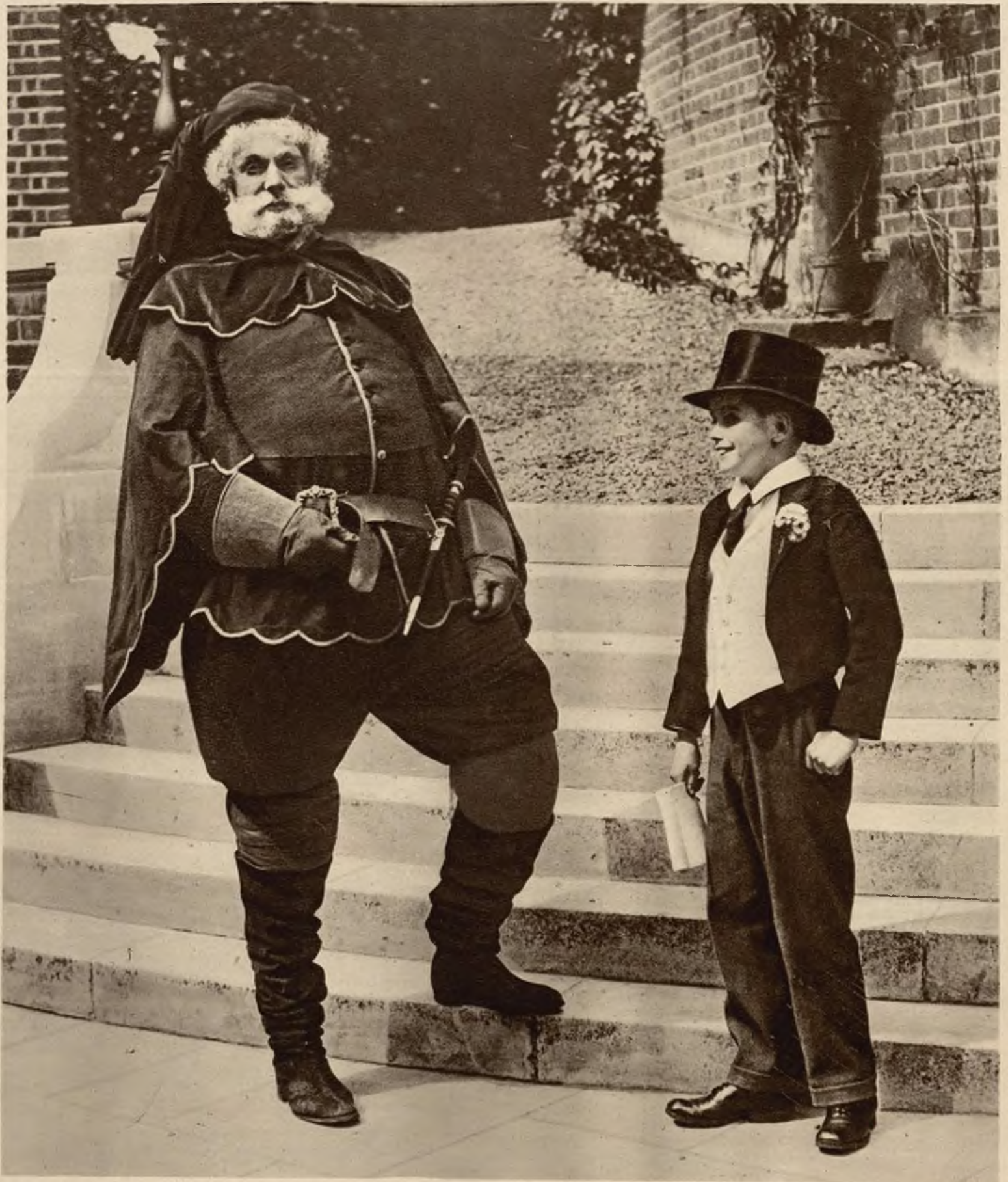
Słynna szkoła angielska w Harrow założona w r. 1571, urządza co roku tradycyjne przedstawienia sztuk Szekspira wykonywane przez uczniów zakładu. Na zdjęciu widzimy byłego ucznia szkoły, wysokiego na 195 cm., który w tym roku odegrał rolę Falstaffa.