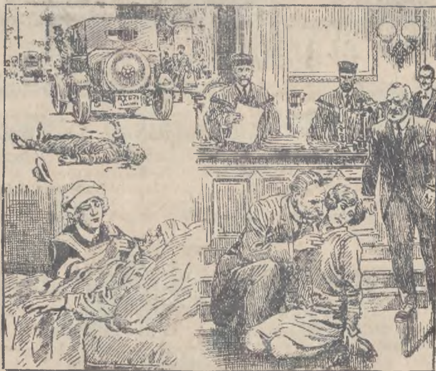
SZLACHETNA TRUCICIELKA. (Do artykułu na str. 7-mej.)

Warszawa, 13 września. (Tel. G. P.) W bież. miesiącu zakończone mają być wszystkie urlopy wypoczynkowe urzędników zajmujących kierownicze stanowiska w urzędach centralnych. Również w tym miesiącu zakończone będą urlopy członków rządu.