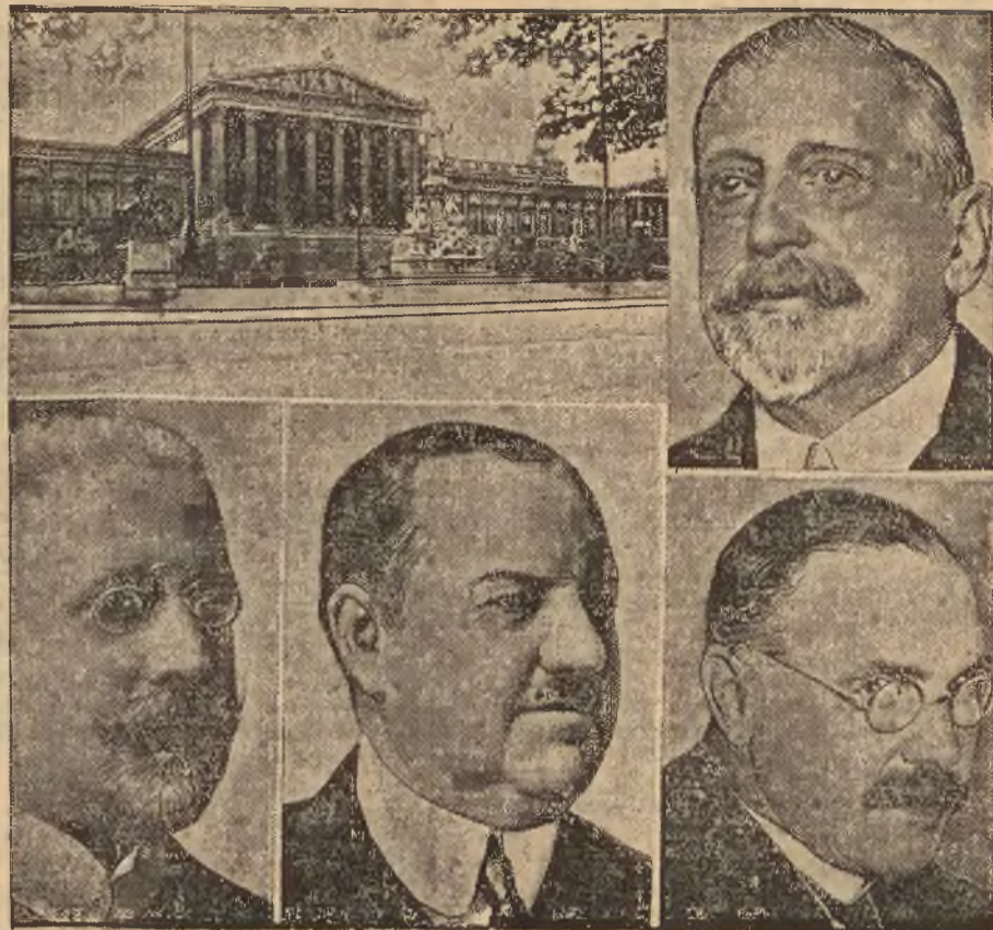
KRYZYS POLITYCZNY W WIENIU.

Następnego dnia na murach miasta ukazały się pstre plakaty treści następującej: