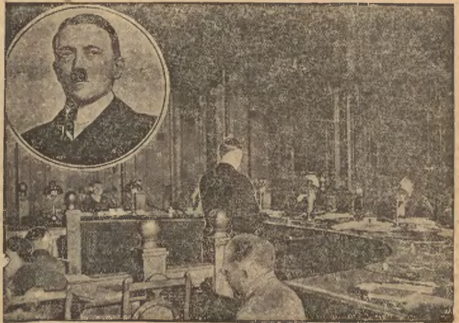
HITLER JAKO ŚWIADK.