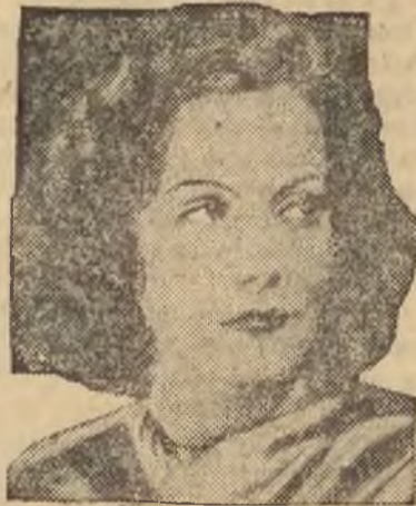
„Boska” Greta Garbo.

Każda gwiazda ma naturalnie swój ulubiony sport. Clara Bow jest namiętną pływaczką. Też namiętności oddaje się