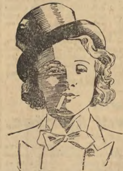
„Europejska Greta Garbo” Marlina Dietrich jako 100% garsonka.