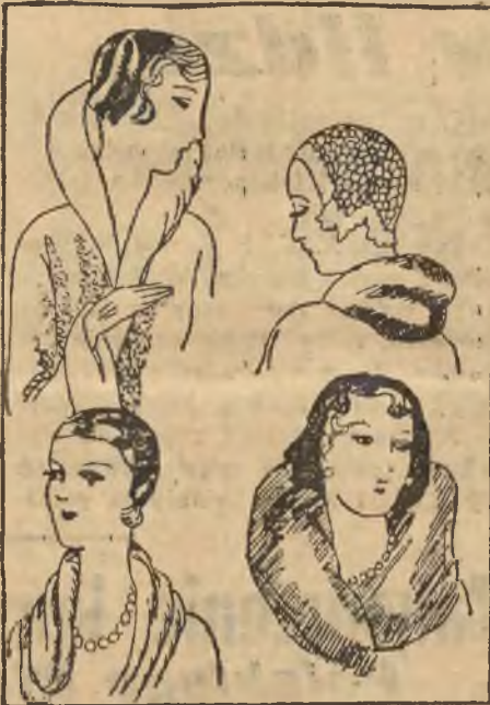
Sposób noszenia kapeluszy.

Jeśli to kółko powiększy się, dzięki odwiedzinom dobrych, zaufanych przyjaciół, z którymi wiąże nas prawdziwa nić sympatii, a nie krepującej konwenans, przyczynia się to do powiększenia otaczającego wszystkich kręgu radości. Nie powinniśmy się obawiać w takich zimowych wieczorach, spędzanych przy ognisku domowym przejąć się do pewnego stopnia mentalnością najmłodszych wśród nas. Możemy stać się niefrasobliwymi dziećmi, bawić się wraz z nimi w ciuciubabkę czy łapankę, czy inne „lata ptaszki“, „pacanki“ i t. p. Przyniesie nam to odświeże-