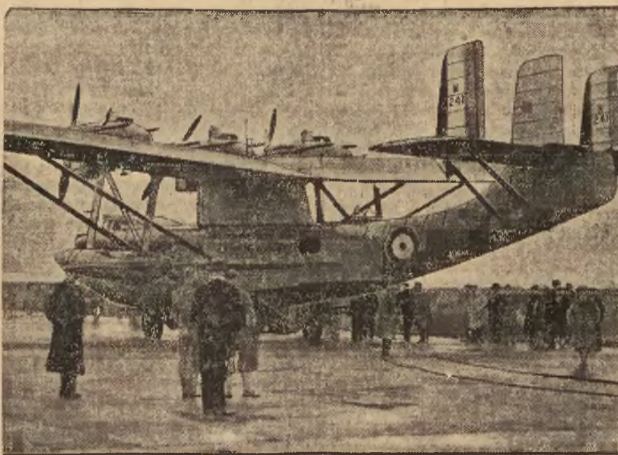
W Brongh (Anglja) zbudowano największy samolot wojskowy. Olbrzym ten, mogący rozwinać szybkość 200 km. na godzinę, sporządzony jest cały z metalu.