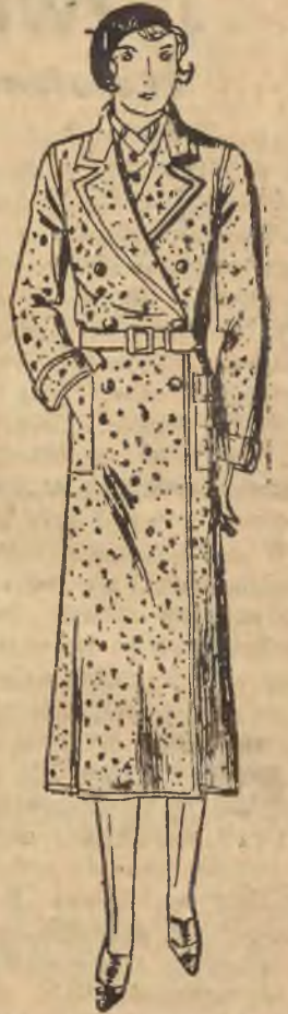
Praktyczny płaszcz z Tweedu.