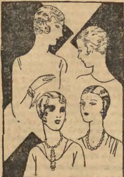
Fryzury do modnych kapeluszy.