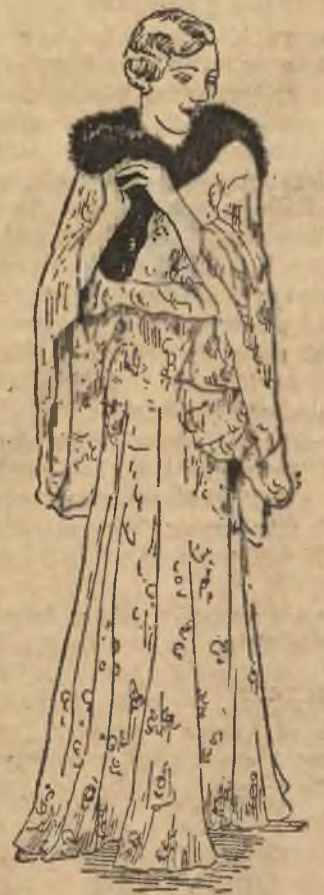
Strójny płaszcz wieczorowy.