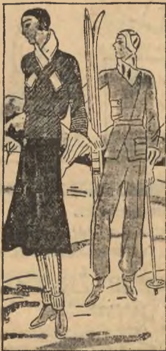
Kostium na saneczki i kostium narciarski

Dobra wola — wola pokoju i miłości, oto cudowna tajemnica Bożego drzewka. Każde zapalone na niem światelko, każde migotliwe świecideł-