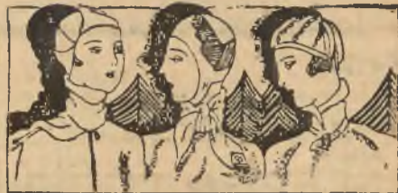
Trzy szykowne esapeczki do kostjumów sportowych, oraz interesujące ubranie szyji.

Do takich długich pantalonów, obcisających nogę w kostce i wpuszczanych do sportowego obuwia, należy jako uzupełnienie sweter i kamizelka krótka, mająca niemal formę bolera. Stan w kostjumie sportowym jest równie wysoki jak w innych toaletach tegorocznych. Takie ensemble daje wrażenie smukłości sylwetki. Uzupełnia kostjum esapeczka z grubej włóczki lub też kask lotniczy z odpowiedniego materiału wełnianego. Okolo szyi owija się szalik wełniany, na ręce ubiera się rękawiczki włóczkowe — jedno i drugie w kolorach żywych dla rozświetlenia stroju. U niektórych pań widzimy także zawijane skarpetki tego samego koloru co szalik i rękawiczki.