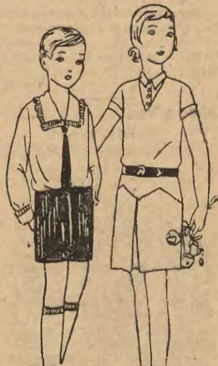
Wygodne ubranie dla dzieci do zabaw zimowych.

Dwa eleganckie kostjomy na ślizgawkę, szykownego i twarzowego stroju sportowego. Względ na niczem nie krepowaną swobodę ruchu, konieczną w sporcie narciarskim, sprawia, że do tych wyczynów używa się dziś przeważnie długich pantalonów, zapewniających zarówno wygodę jak też najprzyzwoitszy wygląd w razie upadku.