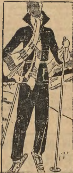
Ciemny kostjum narciarski, ożywiony barwnym jasnym szalikiem i z takąż esapeczką.