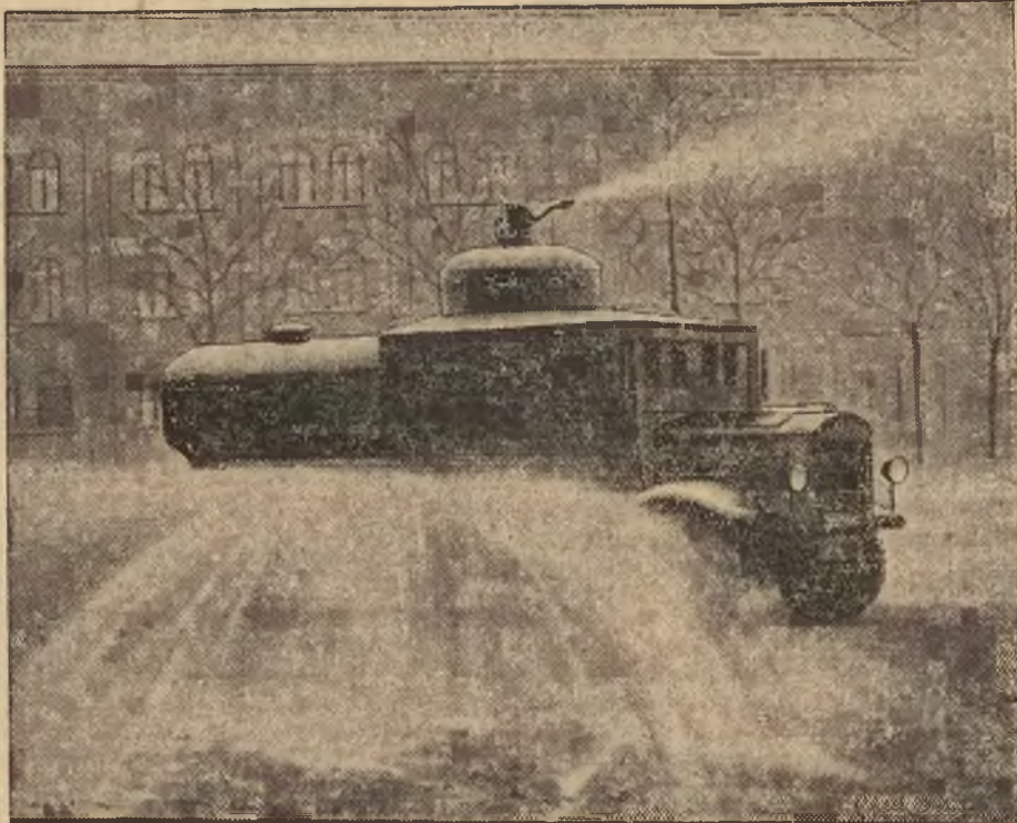
Rycina nasza przedstawia nowy typ zagranicznego samochodu „wodnego”, służącego do rozpraszania demonstrujących tłumów ulicznych. Auto wyrzuca strumienie wody na odległość 40 metrów.