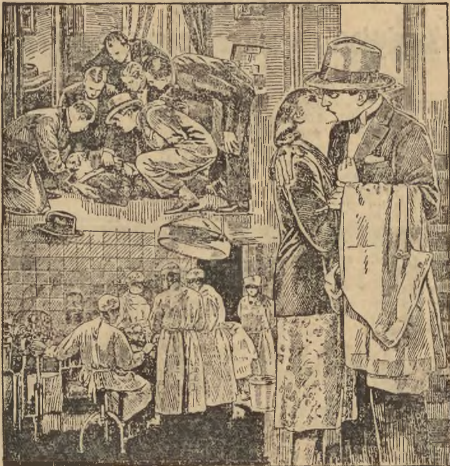
TRAGEDIA AKTORKI. (Do artykułu na str. 10-tej.)

Nowy Jork, 27. grudnia. (PAT). Zmarło tu 11 mężczyzn i 1 kobieta, zaś 59 osób zostało umieszczonych w szpitalach wskutek spożycia w czasie świąt Bożego Narodzenia alkoholu drzewnego.