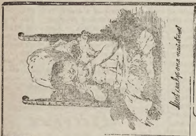
Monte Carlo, 1904

Народної Часописи, Газети Львівської, і Przeglądu може лише се бюро анонси приймати.