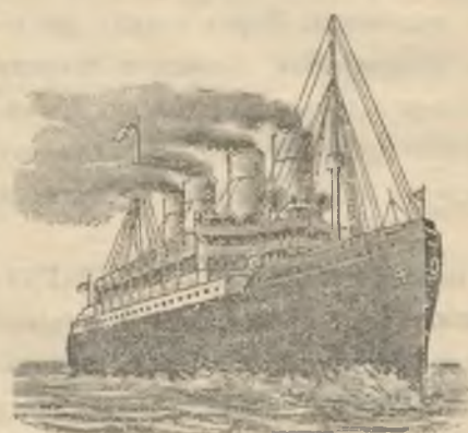
Ц. к. концессионоване

Хто любить свою подругу і хоче наперед поступати, найперечитає собі дра Бок а книжку п. з.: „KLEINE FAMILIE“. За присланем 40 с. в марках лист. G. KLÖTSCHE Verlag Leipzig.