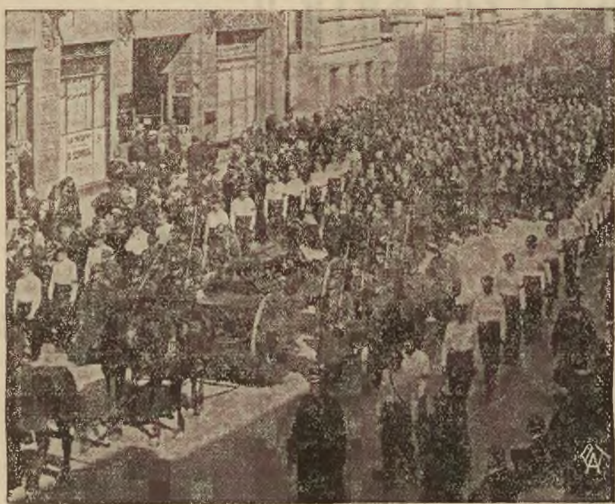
Przed dwoma dniami odbył się pogrzeb znakomitego publicysty, bojownika walk o niepodległość, redaktora Adama Skwarczyńskiego.