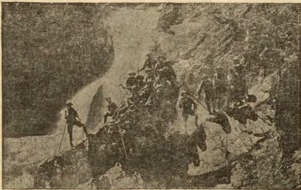
Oboz wędrowny harcerzy wileńskich w Tatrach.

rów Wileńskich powstał z inicjatywy oficerów pułku w roku 1922. Pierwotnie zawiązano sekcje: lekkoatletyczną, piłki nożnej i związek sekcji wioślarskiej. Każdy początek jest trudny, a więc i pierwsze kroki klubu z braku funduszy słabymi być musiały. Jednak wielki zapał i dobre chęci, których żadną sumą pieniędzy zastąpić się nie da, potrafiły w krótkim, bo nie pełnym dwuletnim okresie zorganizować i wyposażyć klub znakomicie. Wyrosła piękna przystań wioślarska, jedyna tego rodzaju budowla na terenie Wilna, dając podwalinę silnie rozwijającej się sekcji wioślarskiej. Byłe dach nad głową i szafkę na garderobę, mówili saperzy, a tabor się znajduje. A no mieli rację—bo po 2-ach szóstkach sprowadzonych z Warszawy „zapał stworzył cuda, a nadzieje obłokł w dwójki, czwórki, spacerówki” „milion” kajaków małych, dużych, szczupłych i pełnych tak, że na otwarcie sezonu sekcja wioślarska wystawi 23 łodzie o 62 miejscach plus dwa skulingi.