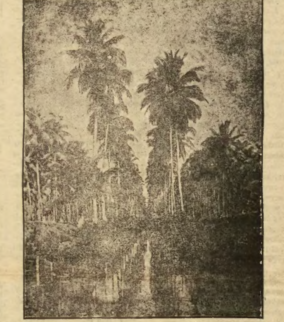
Singapur port angielski, położony pomiędzy Jawą i Półwyspem Malajskim.