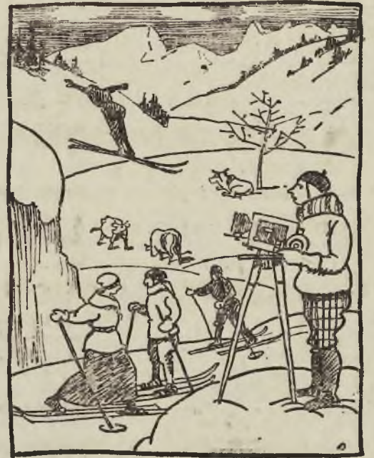
Welche fünf Unmöglichkeiten oder Unwahrscheinlichkeiten enthält dieses Bild?