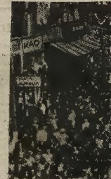
Tłumy paryżan manifestują w dniu święta pracy

Od wczesnego rana Paryż zapachniał konwalia. 1 Maja, święto robotnicze, jest świętem konwalii. Jest to jedyny dzień w roku, kiedy każdemu, bez względu na to, czy posiada pozwolenie, czy nie, wolno sprzedawać konwalle na wózkach, konwalle na wystawach sklepowych, w butikach, na stojakach dziewczęcych. Pachnie morze konwalii.