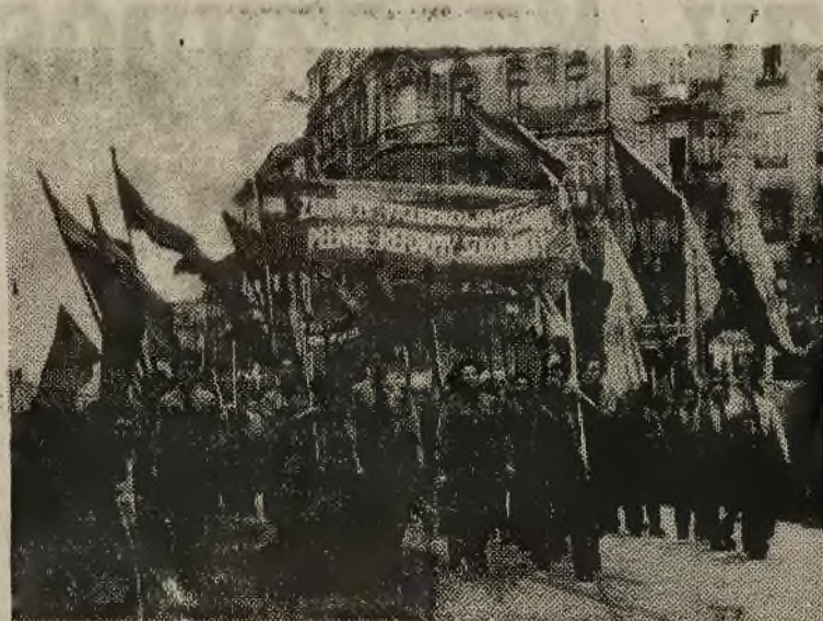
Miedzy starszymi szia i miodziez Na zdejdu miodziez przed trybunami

Trębacz wciąż grają fanfary i w łaci Warszawianki przesuwają się imponujący pochód. Uczestnicy walk o niepodległość, b. więźniowie polityczni, partii. Czerwone łopoczą, zielone i znów czerwone sztandary. Grają motory, tętni po asfalcie przejeżdżająca konno delegacja ze wsi. Tak wielkiej i wspaniałej manifestacji, jak pięknej postawy demonstrujących nie widziała jeszcze