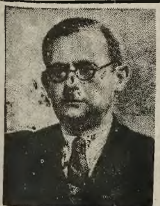
MIN. PRZEMYSŁU I HANDLU TOW. H. MINC

WOJENNA PSYCHOZA W AMERYKAŃSKIEJ REDAKCJI