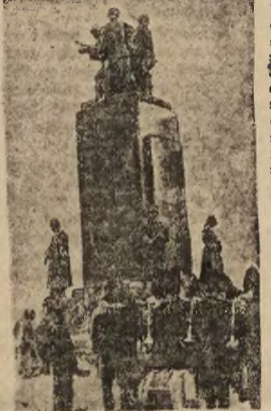
Dowództwo Armii Czerwonej...

Właśnie te uprzedzenia klasowe... Przyjaźń, która przetrwała próbę życia