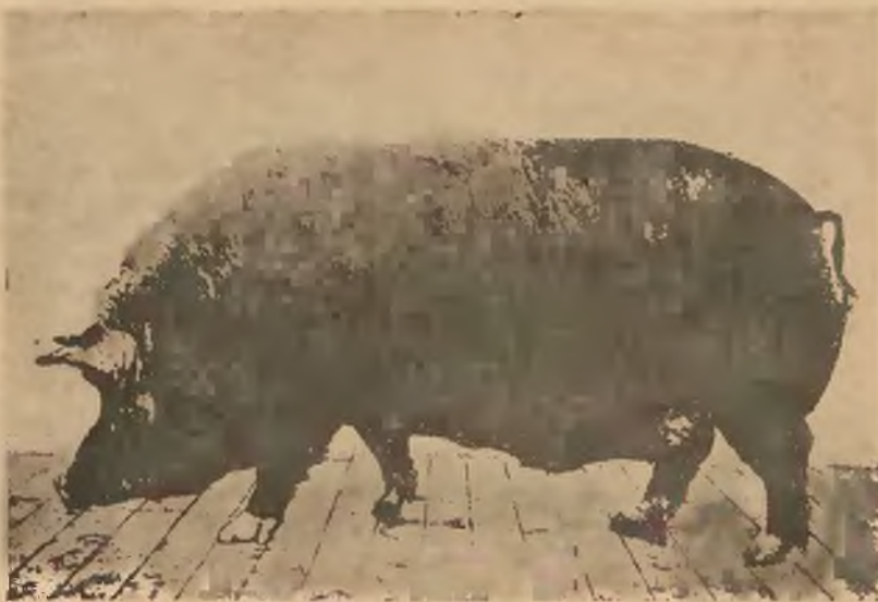
Reproduktor rasy Berkshire.

Berkshirów otrzymywać mogą wzorowe gospodarstwa po jednej a ewentualnie i po więcej sztuk samur z centralnej chlewni rządowej za zniżoną cenę, która przyznana bywa gospodarzom także i przy transakcyi z reproduktorami, w razie, gdyby jeden był dla chlewni zarodowej niewystarczającym.