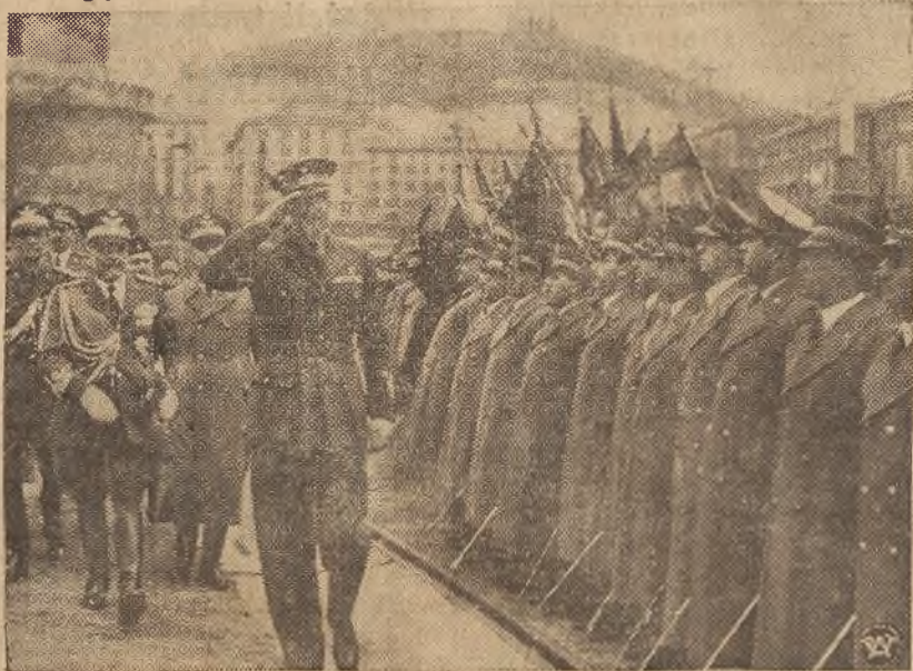
Nowy wicekról Abisynii ks. Aosta przeu wyjazdem do Addis Abeby był serdecznie żegnany przez wojsko i społeczeństwo.