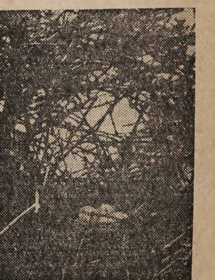
JAJA SOWY W GNIEZDZIE SROKI

Nie tylko niczego złego nie dopatrywano się w sowach, ale przeciwnie, czczono je jako ptaki poświęcone bogini mądrości Minerwie, a że człowiek mądry miał — zdaniem mędrców starożytnych — największe szanse zdobycia pomyślności i dobrobytu, przeto sowa stała się ptakiem nie tylko mądrości, ale i uosobieniem szczęścia! Istotnie, jeśli spojrzeć w mądrą, wyrazistą, pełną głębokiej zadumy oczy puchacza — to raczej mądrość z nich przebija niżeli bezzasadna obietnica nieszczęścia. Do dziś jeszcze utrzymał się w niektórych instytucjach kulturalnych i oświatowych obyczaj umieszczania posążka sowy, godła wiedzy i mądrości.