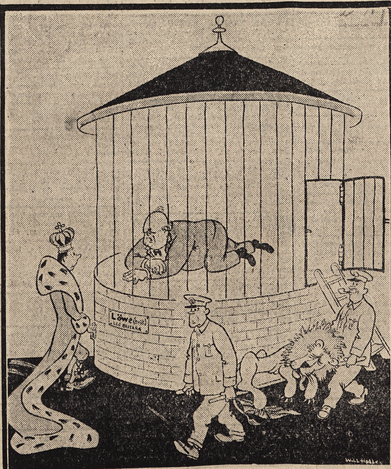
SUROGAT LWA BRYTYJSKIEGO

MADRYT, 19. 10. — Z okazji dni uroczystych w Hiszpanii przesłał hiszpański minister spraw zagranicznych generał hr. Jordana przez radio pozdrowienie Hiszpanii i jej wodza narodowi argentyńskiemu i jego wodzowi. Argentyński minister spraw zagranicznych Ruiz Guinazu przedstawił w swojej mowie „w dniu rasy” swój pogląd na drogi, którymi w przyszłości należy kroczyć, a które pokrywają się z wolą Hiszpanii dzisiejszej.