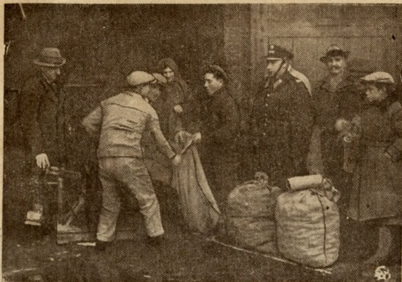
Zdjęcie przedstawia rozdawnictwo ziemniaków bezrobotnym przez Stołeczny Komitet Zimowej Pomocy Bezrobotnym.