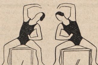
Fig. 28. Siad na krześle — jedno ramię w bok drugie na biodrze — i skłony w lewo i prawo z zamachem odpowiedniego ramienia.