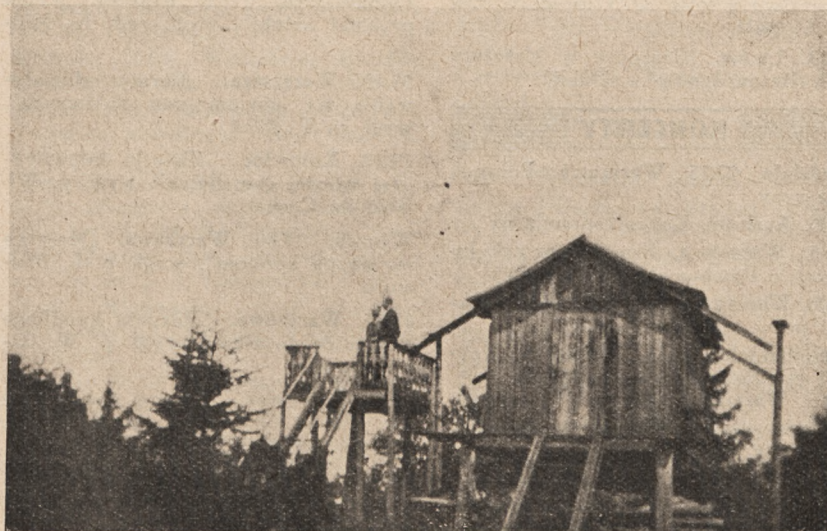
Pawilon z lunetami na Łysinie.

amatorów astronomów) pozwala na dowiedzenie się wielu szczegółów o najdalszych z pośród gwiazd, nieraz niedostępnych dla innych metod badania (n.p. spektroskopem lub t. p.)