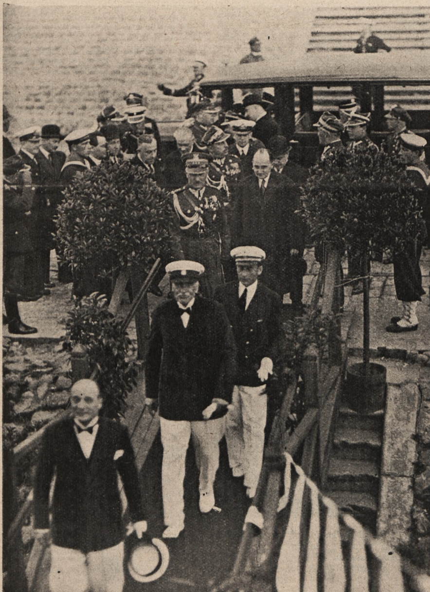
Pan Prezydent Rzplitej w otoczeniu dostojników Państwa i Generalicji podczas uroczystości „Święta Morza” na Wiśle.

Programy na tydzień od 9/VII do 15/VII | Cena numeru bez przesyłki gr. 25