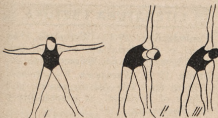
Fig. 27. Rozkrok — opad wprzód, ramiona w bok i skrety tułowia w prawo i lewo.