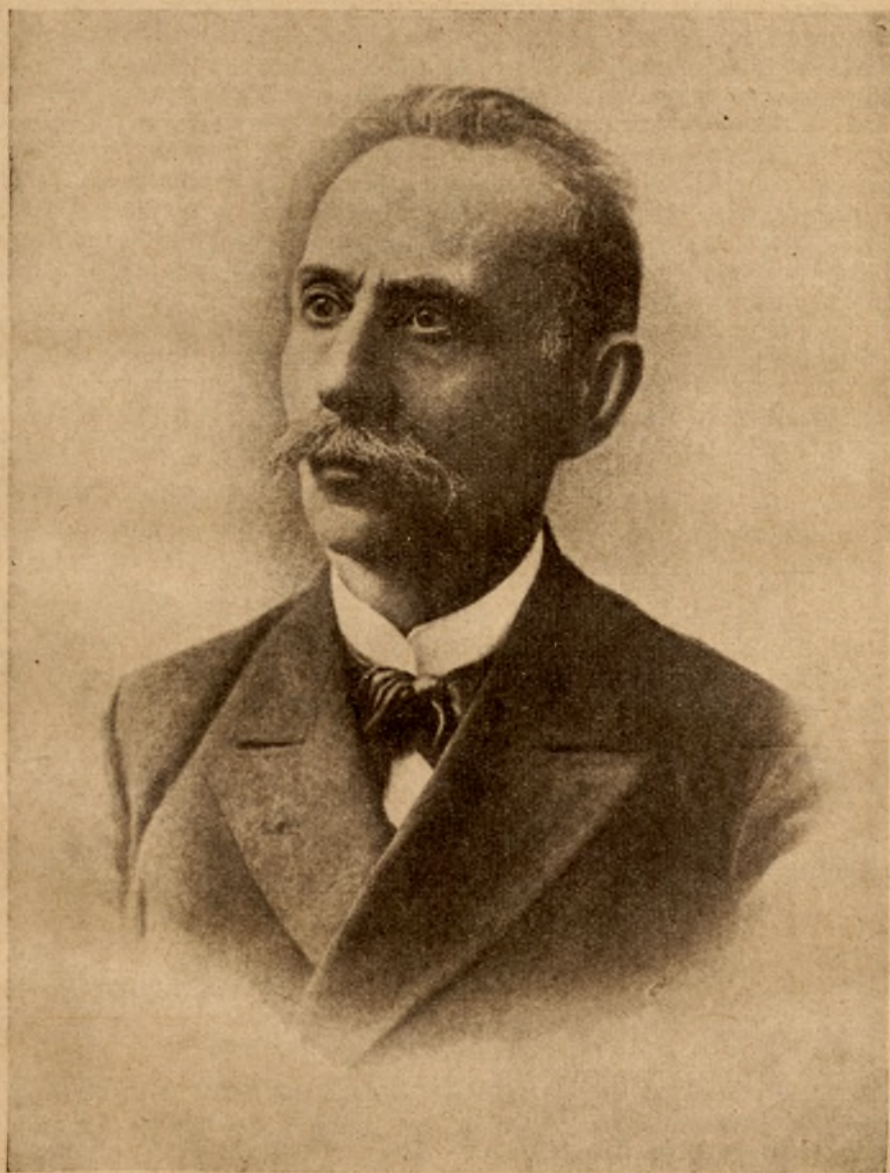
Ismayl Bey Gasprinsky