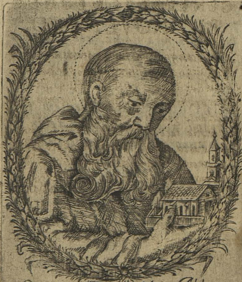
Sanctus Romualdus Abbas Cassaldulensium Pater.