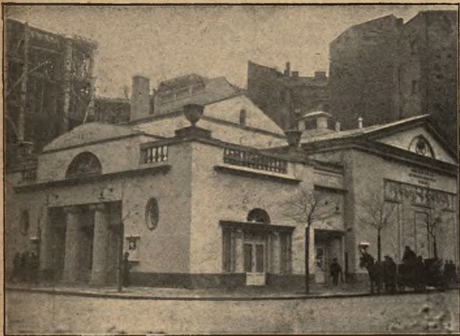
Z teatrów warszawskich: Budynek Teatru Nowoczesnego.

wdzięczyć zaprowadzenie opału ropą na kolejach w Galicji.