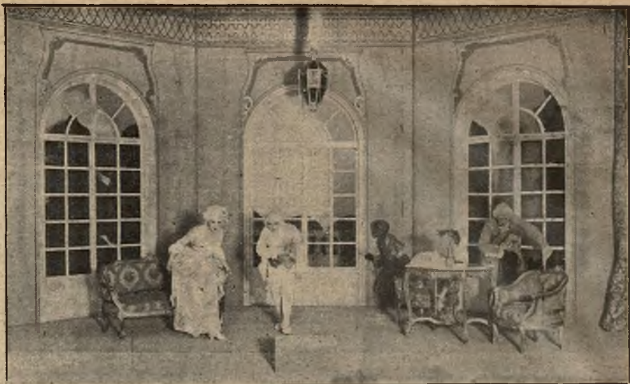
Z teatrów warszawskich: Scena z „Edukacji niekompletniej” Chabrierea, wystawionej w Teatrze Nowoczesnym z dekoracjami pomysłu prof. Z. Trojanowskiego.

mandat z okręgu chrzanowskiego i zastępuje obecnie interesy górnictwa węglowego.