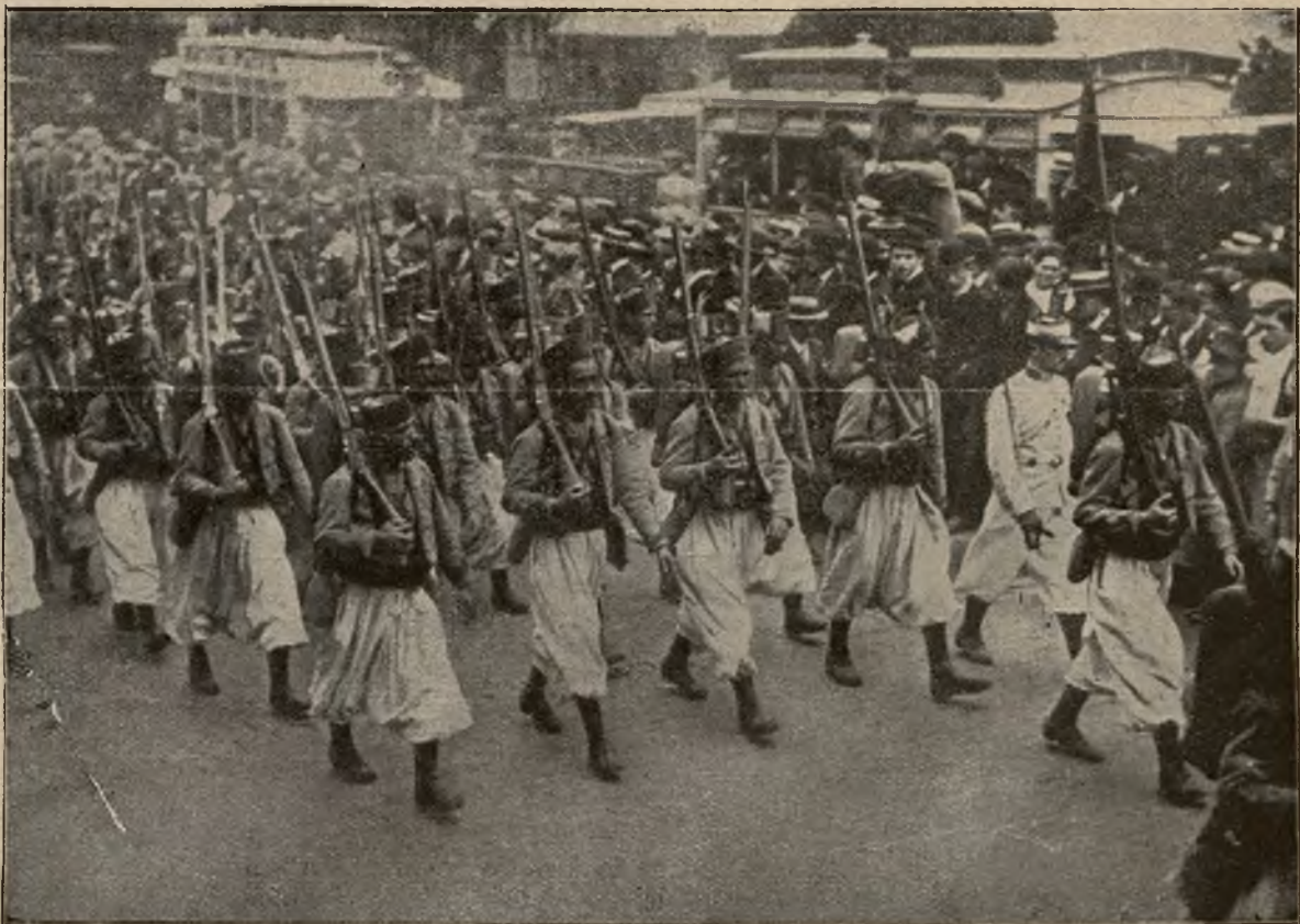
Kolorowe wojska: Strzelcy algierscy w armii francuskiej.

cuzi w obecnej wojnie, „niewidoczna” piechota niemiecka zdziesiątkowała zaraz w pierwszych bitwach barwnych żołnierzy francuskich.