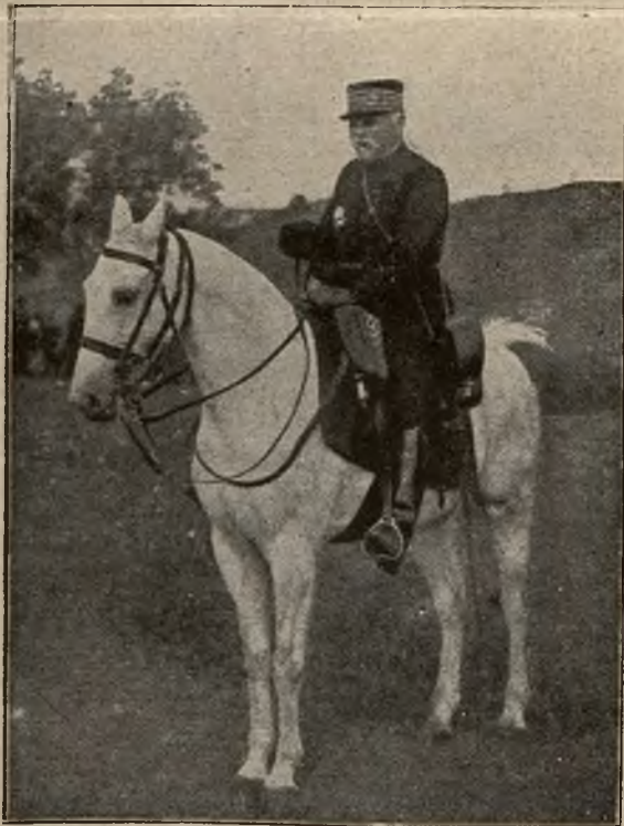
Na teatrze wojny: General Pau, generalissimus armii francuskiej, który w wojnie 1870/71 stracił prawą rękę.

jej już korpusy europejskie, a teraz, po rozbiciu ich, przesłała tam swych indyjskich strzelców, a Francja chce ściągnąć swe wojska z Indo-Chin.