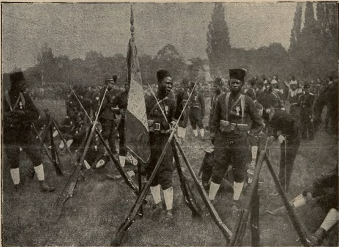
Kolorowe wojska: Piechota senegalska w armii francuskiej.