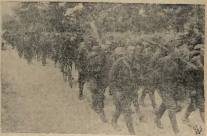
Manewry jesienne armji czeskiej, na które przybyły specjalne misje armji sowieckiej, rumuńskiej, jugosłowiańskiej i francuskiej. Na zdjęciu przemarsz oddziałów przez włoskę.