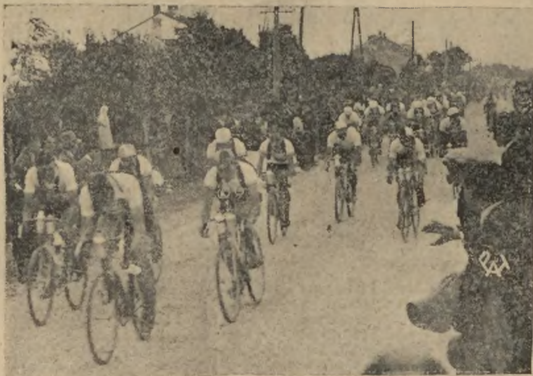
Fragment emocjonującego wyścigu kolarskiego Warszawa — Berlin. Na zdjęciu zawodnicy w chwili po starciu z Chrzanowa.