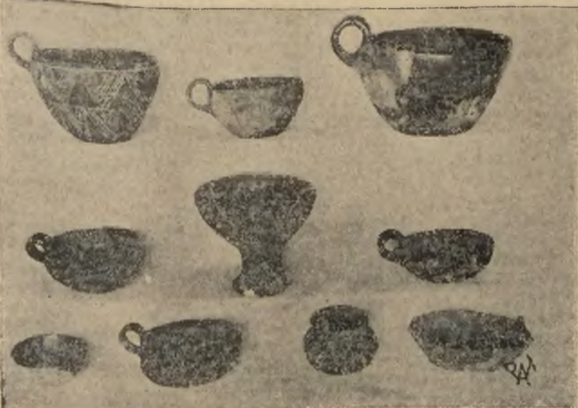
Podczas energicznych poszukiwań na terenie osady bagiennej sprzed 2500 lat w Biskupinie znaleziono wiele pięknych okazów ceramiki przedhistorycznej. Na zdjęciu naczynia gliniane, czernaki, puhan, kubki i t. p. znalezione na terenie osady. Poszukiwania są prowadzone w dalszym ciągu nie ma dnia by niedokonano nowych rewelacyjnych odkryć.