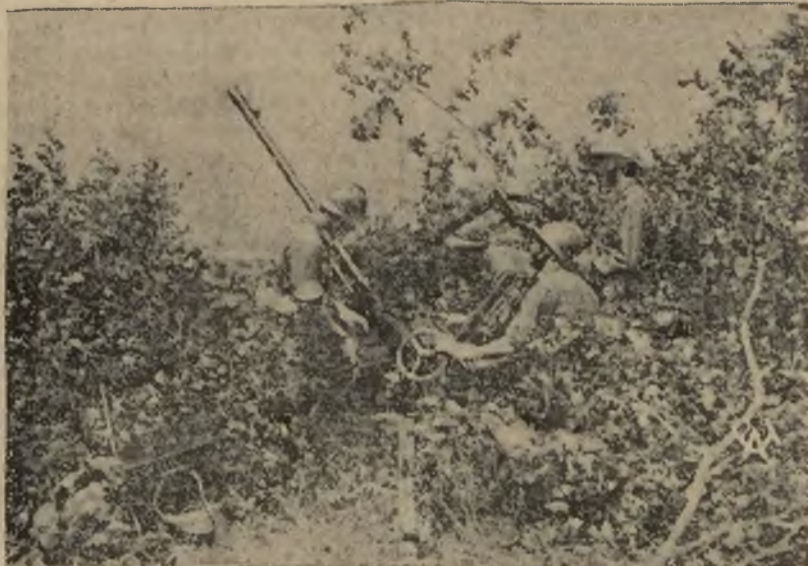
Próba nowego włoskiego szybkostrzelnego karabinu maszynowego, 20 milimetrowego, przeznaczonego do działań wojennych w Abisynji.