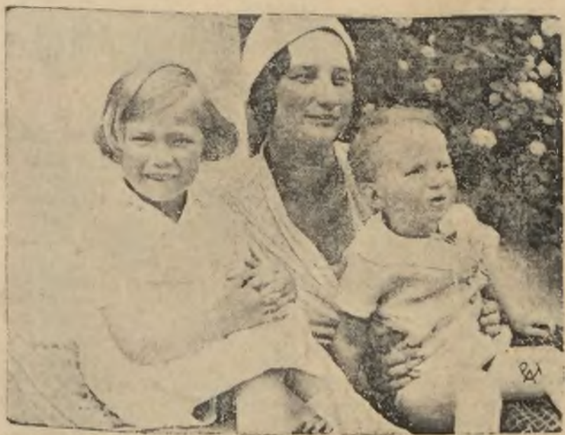
Królowa belgijska Astrid, zginęła tragicznie w katastrofie samochodowej w Merlishachen nad jeziorem Czterech Kantonów. Na zdjęciu s. p. Królowa Astrid z dwojgiem starszych dzieci 8 letnią Józefiną Charlottą i 5 letnią następcą tronu, księżciem Brabantu Baldwinem.