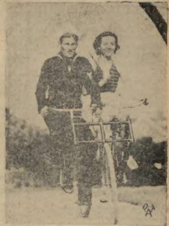
Nowa moda amerykańska. Rower dwuosobowy, cieszący się dużym powodzeniem, szczególnie na letniskach oraz na plażach.