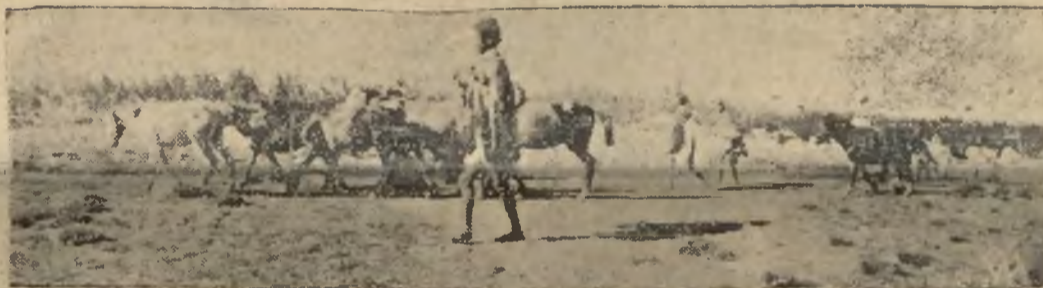
Rekwizycja koni w Abisynji.