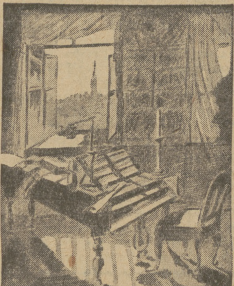
Pokój Beethovena, w którym mistrza zastała śmierć.