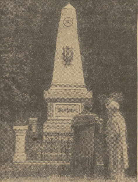
Pomnik R. Beethovena na Centralnym cmentarzu w Wiedniu.