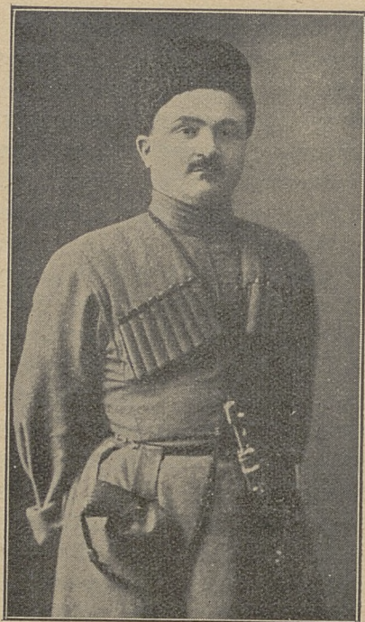
АХМЕД ЦАЛЫККАТЫ (ко 2-ой годовщине его смерти)