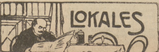
Thorn, den 19. April.

Pleschen. Eine heitere Lotteriekegelschichte hat sich hier dieser Tage zugetragen. Vor einigen Wochen hatte sich der Landwirt N. aus dem Nachbardorfe Neudorf von einem hiesigen Bürger, der sich eine Anzahl der bekannten 1 Mark-Lose einer Pferdelotterie hatte kommen lassen, ein Los gekauft. Vor einigen Tagen erhielt N. eine Depesche des Inhalts, daß er mit seinem Lose ein Reitpferd für 2000 Mark gewonnen habe. Der glückliche Gewinner eilte nach der Stadt, um nähere Erkundigung einzuziehen, und hier hatte sich das Gerücht unter seinen Freunden und Bekannten schnell verbreitet, jeder gratulierte herzlich. Natürlich mußte, wie bei solchen Gelegenheiten üblich, der Gewinn auch „begossen“ werden. Als N. mit seinen Gratulanten noch ein zweites Lokal aufsuchte, traf er zufällig mit dem Losverkäufer zusammen. Als dieser von dem Gewinn erfuhr, war er nicht wenig erstaunt, da er doch vor allen Dingen hätte eine Nachricht erhalten müssen. Er schloß die Verabredung und beide gingen nun nach der Post, um sich von der Echtheit der Depesche zu überzeugen. Hier wurde ihnen denn auch mitgeteilt, daß die Depesche gefälscht gewesen sein müsse und es sich wohl um einen „Scherz“ handelte. Ob sich der betreffende „Witzbold“ vielleicht auch am „Begießen“ des Gewinnes beteiligt hatte, davon schweigt des Sängers Höflichkeit.