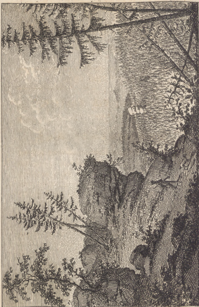
Der Bärenstein bei Schreiberau