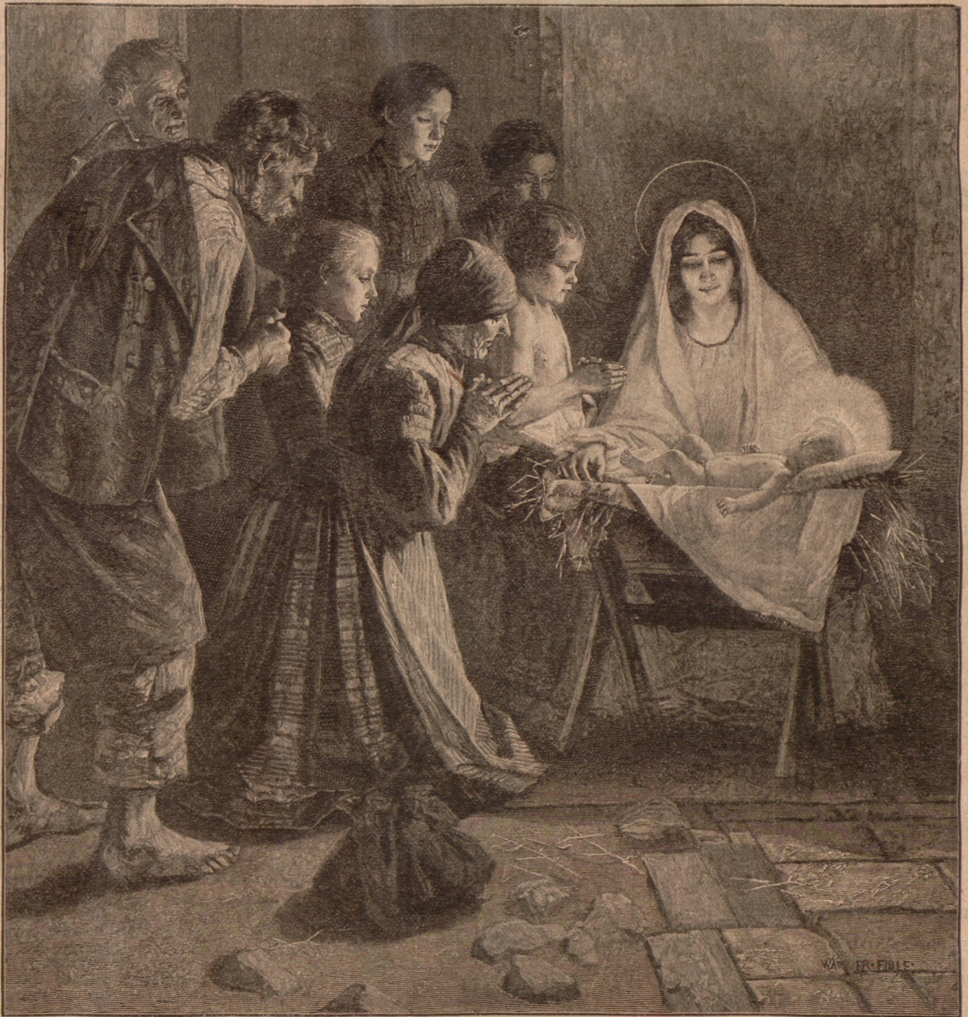
Die heilige Nacht. Nach dem Oelgemälde von Walter Firls.

Sie es mich Ihnen gestehen und nun möchte ich Sie fragen: Wie wäre es, wenn wir beiden Einsamen uns zusammenhätten fürs Leben?" Er sah ihr fragend in das erglühende Antlitz und hielt ihr die Hand hin. Da legte sie mit warmem Drud die ihre hinein und sah zu ihm auf. "Die Christglocken