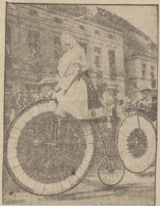
Ein lustiges Bild vom Spreewald-Trachtenfest in Belschau