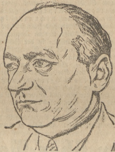
Der 608. Reichstagsabgeordnete

Washington. Hohe Beamte des Schatzamtes erwarten, die Regierung der Vereinigten Staaten erwarte, daß die Schuldnerländer, die am 15. Dezember d. J. fälligen Kriegsschuldenraten an Amerika bezahlen. Die Regierung der Vereinigten Staaten sei nicht in der Stimmung, weitere Anträge auf Zahlungsaufschub zu berücksichtigen. Sie erwarte daher, daß keine derartigen Anträge gestellt würden. Das Schatzamt lasse sich durch die große Stimmungsmache für eine Kriegsschuldensstreichung nicht beeinflussen. Die amerikanische Regierung sei davon unterrichtet, daß fast alle Schuldnerländer die nächste Jahreszahlung leisten können. Sollte jedoch trotzdem eine Schuldnernation die Zahlungserleichterung beantragen, so würde der Antrag individuell geprüft werden. Durch eine solche Politik würde selbsttätig eine Einheitsfront von europäischen Schuldnern ein Ergebnis entgegengesetzt. Die hohen Beamten betonten, daß die amerikanische Regierung sich schadlos halten würde, falls irgend ein Schuldner eine Verpflichtung nicht erfüllen sollte. Zum Schluß ihrer Ausführungen wiesen sie erneut auf die Haltung im Kongreß hinsichtlich der Schuldfrage und die Tatsache hin, daß ein Ausfall der Schuldnerstaaten den Haushalt der Vereinigten Staaten über den Haufen werfen würde.