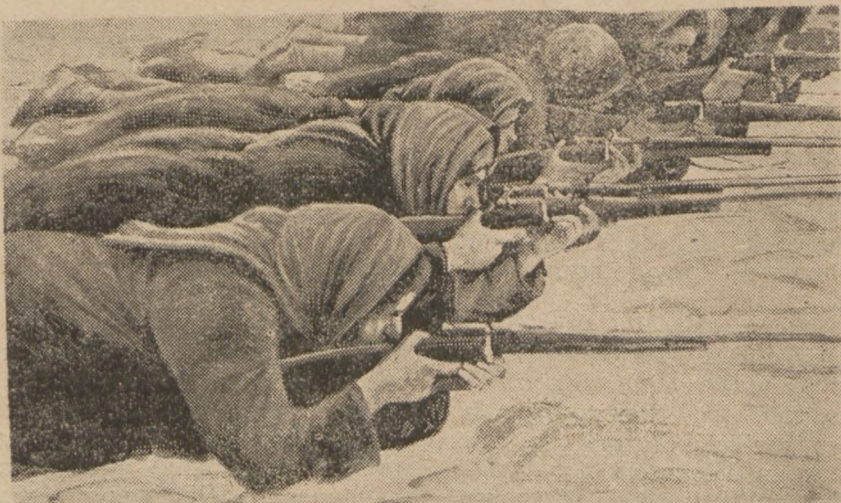
жіночі відділи червоної армії.

Червона армія знадоблена впрочім усіми найновішими воєнно-технічними заобами, як гази, літаки, танки (повзи) і т. д. Велику надію кладуть большевики на спеціальні