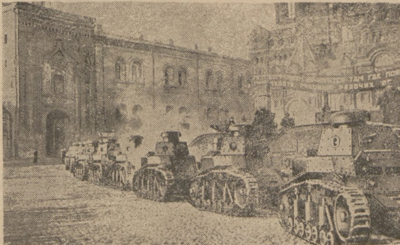
Танки (повзи) на вулицях Москви.

Начальний командант большевицької армії Ворошилов зажадав підвишки військового бюджету ССРСР. Він заявив, що червона армія мусить перевести повну реорганізацію своєї артилерії і на це треба великих грошей. Щодо спору з Китаєм, то Ворошилов запевнює, що червона армія є готова до бою і впро-