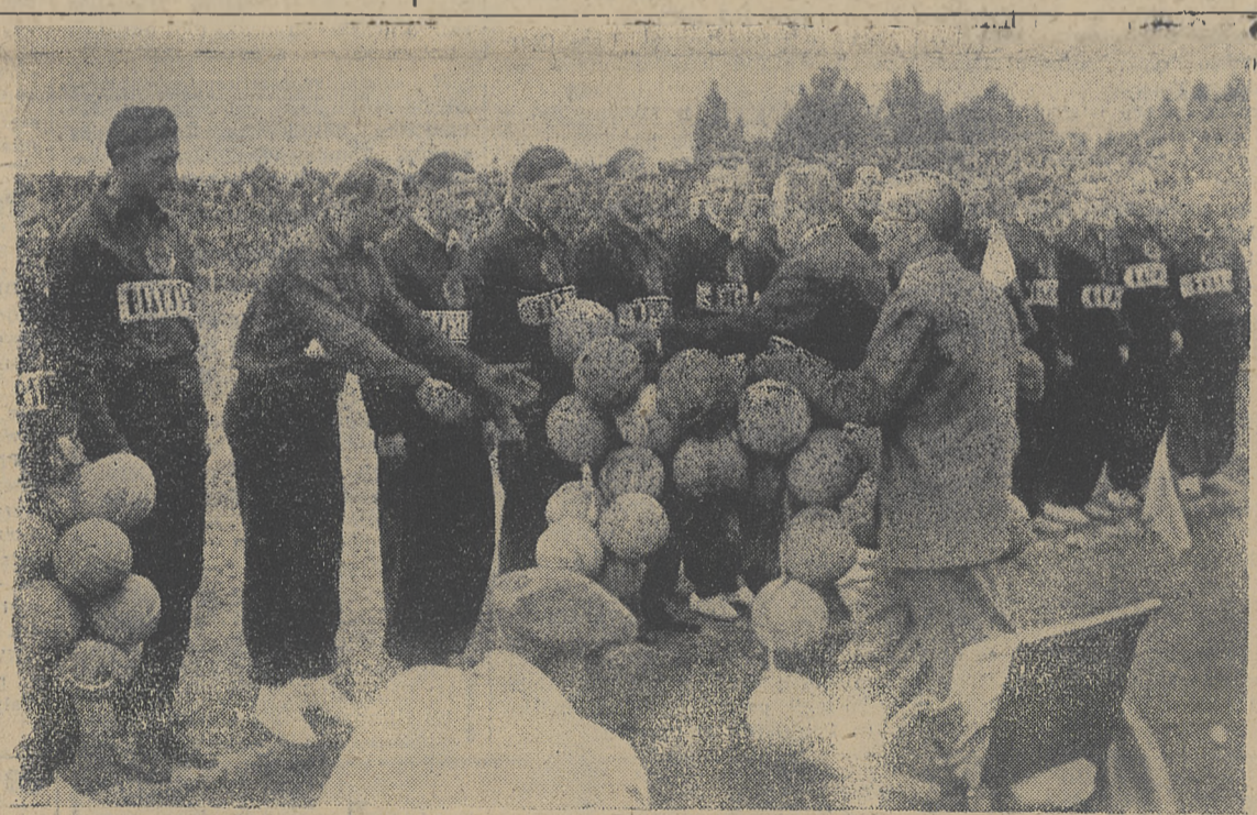
300 piłek otrzymali przedstawiciele LZS-ów, ze wszystkich województw, od zarządu PZPN. Z okazji jubileuszu 30-lecia istnienia naczelnej magistratury polskiego footballu. W wyrównanym szeregu ustawili się przedstawiciele Warszawy, Białegostoku, Poznania, Rzeszowa, Olsztyna, Wrocławia, Kielc, Łodzi, Szczecina, Lublina, Bydgoszczy, Gdańska, Katowic i Krakowa. Należy dodać, że Duńcicy, dowiedziawszy się o akcji PZPN, ze swej strony ofiarowali 5 piłek prosząc o obdarowanie nimi Ludowych Zespołów Sportowych.