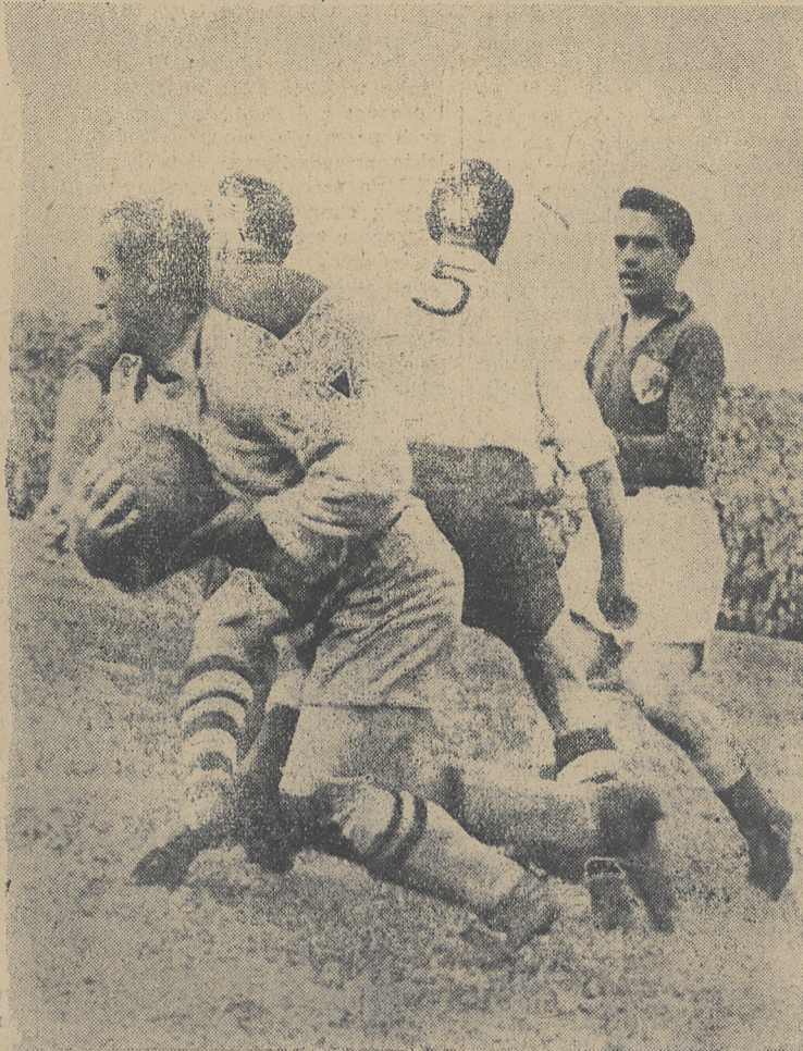
Duńcicy z zasady atakowali polskiego bramkarza. Rybicki nie wiedział jak uwolnić się od agresorów i tym razem z pomocą przyszedł mu Parpan (odwrócony, który szachuje Praesta na prawo)