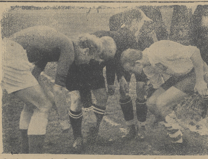
Orzeł czy Reszka. Parpan wylosował szczęśliwie. Polacy rozpoczęli grę z wiatrem.

Związek Radziecki walczył w tej wojnie sam. Churchill i jego klika zdradziecko hamowały utworzenie drugiego frontu. Wiadomo, że inwazja we Francji rozpoczęła się w momencie, gdy Czerwona Armia zadała hordom faszystowskim śmiertelne ciosy, gdy stało się jasnym, że Związek Radziecki jest w stanie o własnych siłach wyzwolić całą Europę. ZSRR bohaterstwem swego żołnierza, genialnością swej strategii i siłą swego patriotyzmu i nienawiści do faszystowskiej uchronił od zagłady cywilizację ludzką. Miast osłabionego, wyczerpanego w walce Związku Radzieckiego wyszedł z tej wojny jeszcze bardziej wzmocony, a jego znaczenie i autorytet