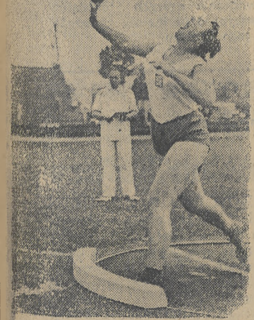
Komarkowa (CSR) wygrała pewnie rzut kulą w meczu Polska — CSR mając wszystkie rzuty ponad 12 m.