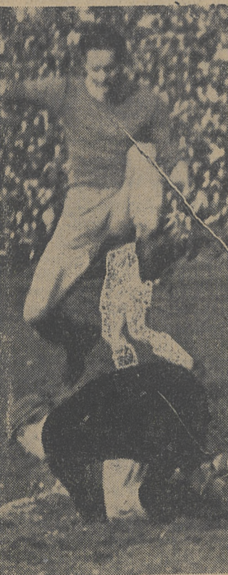
Z meczu Polonia Bytom — EKS