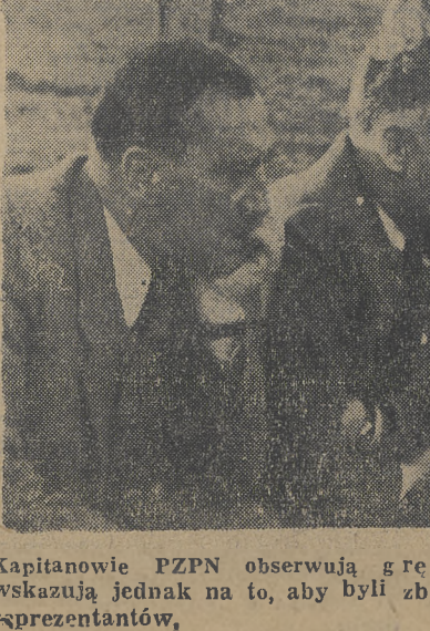
Kapitanowie PZPN obserwują grę swych pupilów. Miay ich nie wskazują jednak na to, aby byli zbudowani wyczynami naszych reprezentantów,

Zwycięstwo, które nie cieszy. W takich warunkach bojowy i ambitny zespół Polski musiał odnieść zwycięstwo. Koncepcja po znańska zbudowana przy końcu sezonu nie dała jednak kapitanowi żadnego pozytywnego materiału na rok przyszły.