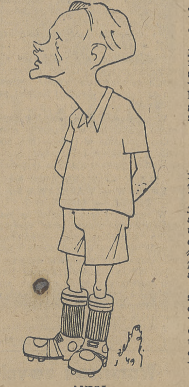
ANIOŁA nieprzemysłanych akcji, nie były budowane w polu, wynikały z przypadku, z błędów przeciwnika, a najczęściej z mniej lub więcej udanych improwizacji.