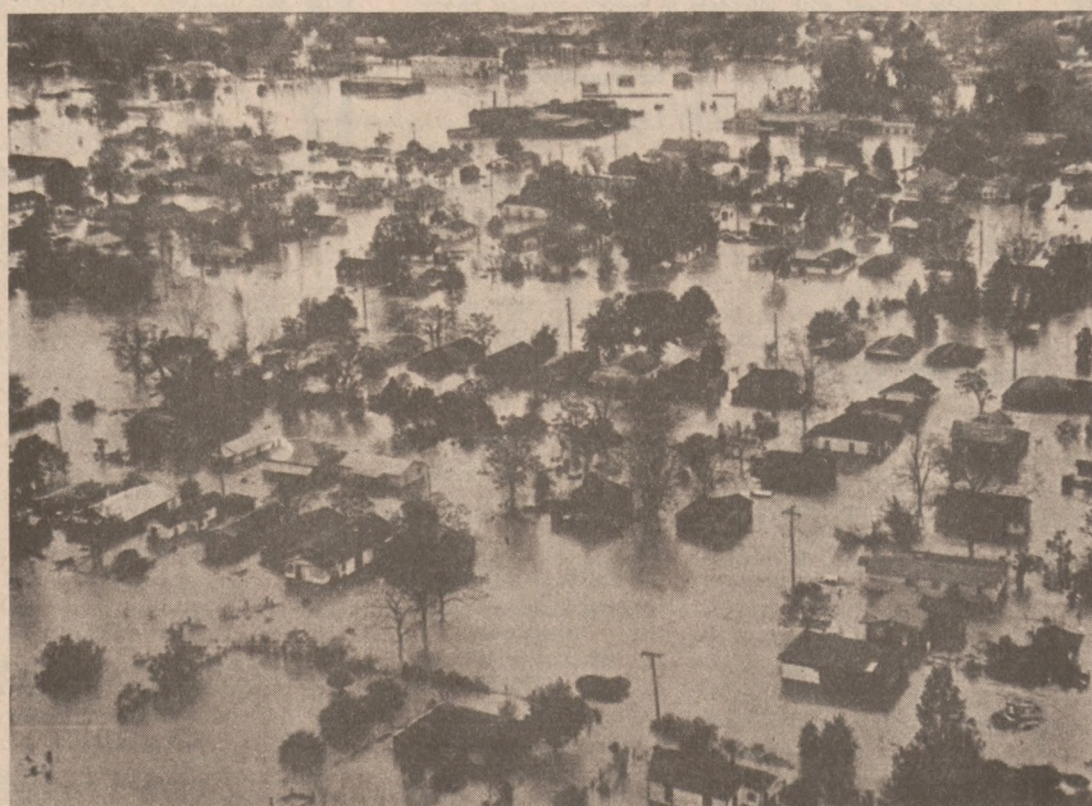
HATTIESBURG, MISS. — Topniejące śniegi na północy kraju i ulewne deszcze w rejonach centralnych, spowodowały nagły przybór wody niedaleko ujścia rzeki Mississippi i gwałtowną powódź. Kilka tysięcy ludzi ewakuowano przymusowo z terenów najbardziej zagrożonych.

Czerwony Krzyż ostrzega rybaków i łodkarzy, iż woda jest w obecnej porze roku jeszcze bardzo zimna i może być przyczyną śmierci. Nawet doświadczeni pływacy mogą utonąć, gdy unieruchomi ich lodowata woda.