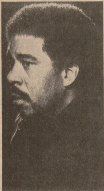
LOS ANGELES. — Znany aktor komediowy — Richard Pryor, skazany został wyrokiem sądu federalnego za notoryczne przestępstwa podatkowe, których dopuszczał się począwszy od roku 1967.

W ostatnich miesiącach niektórzy politycy zaczęli zastanawiać się, czy ochronę otoczenia można uważać wciąż za dobry czynnik w polityce. Efekt Watergate dał się już poważnie odczuć w kraju, gdyż spora część z silnych potencjalnie kandydatów republikańskich rezygnuje z ubiegania się, tak twierdzą przedstawiciele sondaży w kraju.