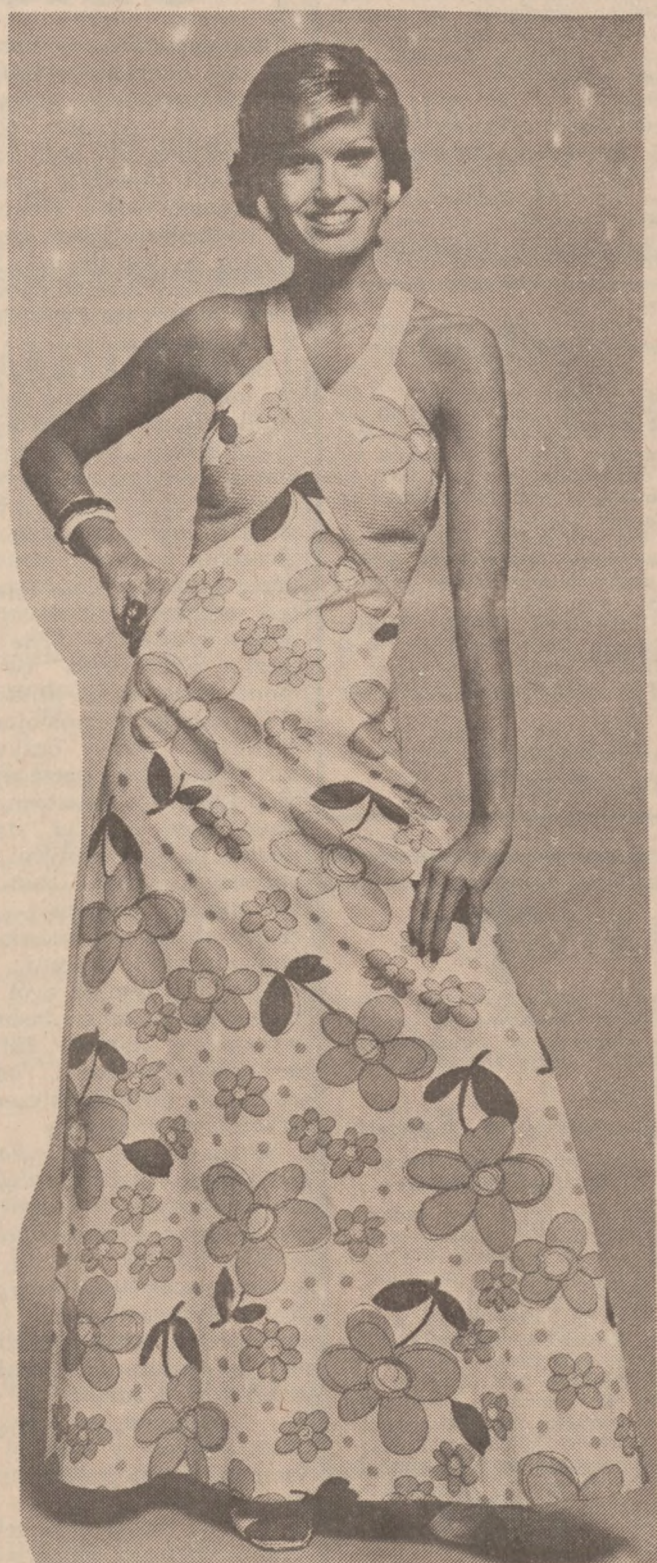
Letnia suknia z wzorzystej bawełny odpowiednia na zabawy i przyjęcia.