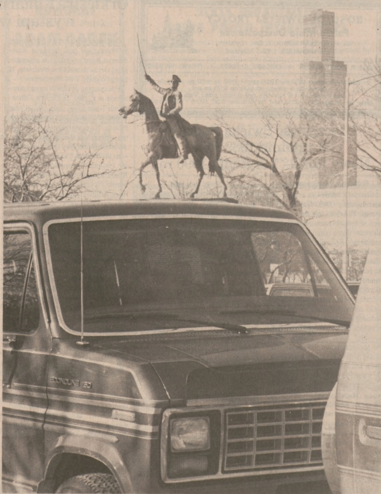
Chicago — Pomnik Tadeusza Kościuszki, w śródmieściu, nad jeziorem Michigan.

W operacji — według wstępnych założeń — ma wziąć udział amerykański lotniskowiec oraz kilka