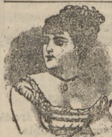
Dama w wieku lat 57. kowskie-Przedmieście 192r Nr 9.