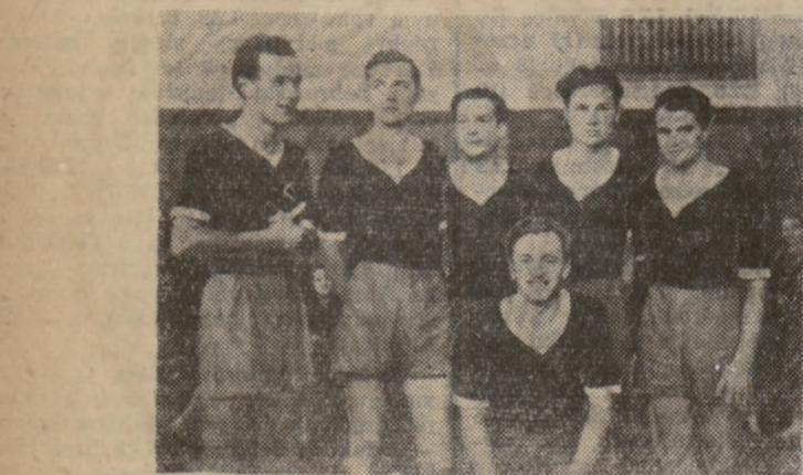
W turnieju kół sportowych w siatkówce wyróżniło się koło sportowe P.M.T., którego zdjęcie zamieszczamy powyżej.

Na skutek nieprzebiegu wyznaczonych sędziów p. Selfert B. prowadził 14 spotkań.