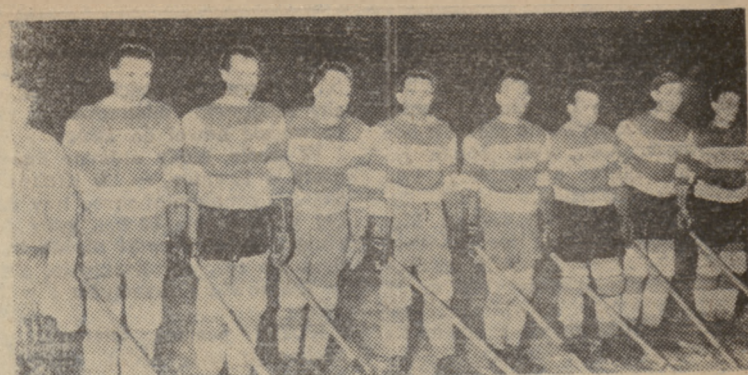
Drużyna mistrza Polski w hokeju na lodzie — Ogniwo Cracovia, która w ub. sobotę pokonała w meczu o mistrzostwo ligi hokejowej zespół krakowskiej Gwardii 5:2.

Na zakończenie zebrania odśpiewali Międzynarodówkę, po czym nastąpiło rozdanie nagród zwycięzcom turnieju szachowego.