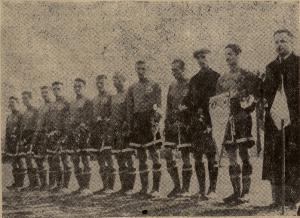
Piłkarski zespół radziecki, wicemistrz ZSRR Dynamo Tbilisi, rozegrał w Polsce cztery spotkania, uzyskując trzy zwycięstwa i jedną nierozegraną, oraz straconek bramek 10:1. Na zdjęciu Dynamo przed meczem z Gwardią, na boisku krakowskim.