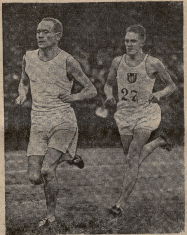
Na obrazku tym widzimy króla biegaczy Finna Paavo Nurmi'ego na zawodach w Warszawie w konkurencji z polskim czołowym biegaczem Petkiewiczem w dniu 8. 9. br. Jak wiadomo Petkiewicz pokonał Nurmi'ego w biegu na 3000 m. (o pierś), uległ mu natomiast w biegu na 4 mile ang. Na obrazku — Nurmi prowadzi.

Najlepszy zawodnik: Mikrut Wład. — nagroda p. Starosty Krajowego Najlepsza zawodniczka Ziółkiewiczówna, Bydgoszcz m. nagroda p. Dowódcy Korpusu.