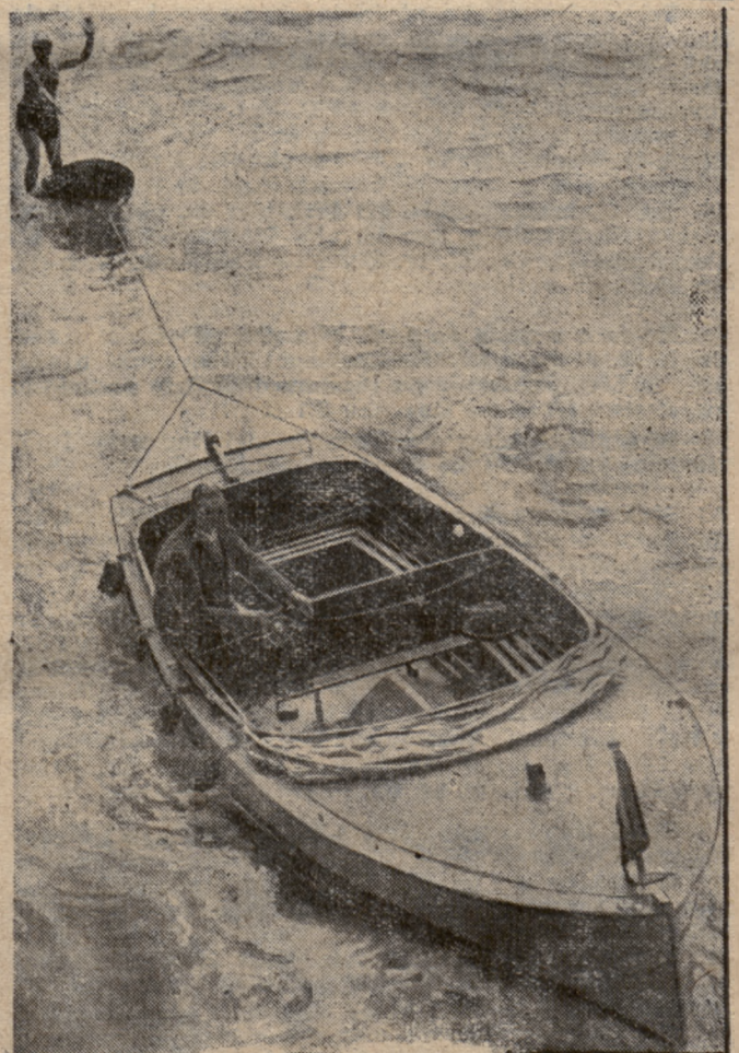
Sport wodny na Tamizie