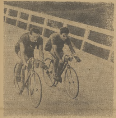
Jugosłowianie Horwete i Porębski samotnie prowadzili w wyścigu z Żilina do Katowic, mając niejednokrotnie 10 minut przewagi. Mimo to zostali wyprzedzeni na mecie przez Czechów Krejcu.