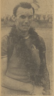
Kremer (CSR) ugrał kolejną drugą stopę z Żilina do Żiliny i z Żilina do Katowic dzięki czemu zdobył kosztu lidera którą utracił jednak w Kielcach.